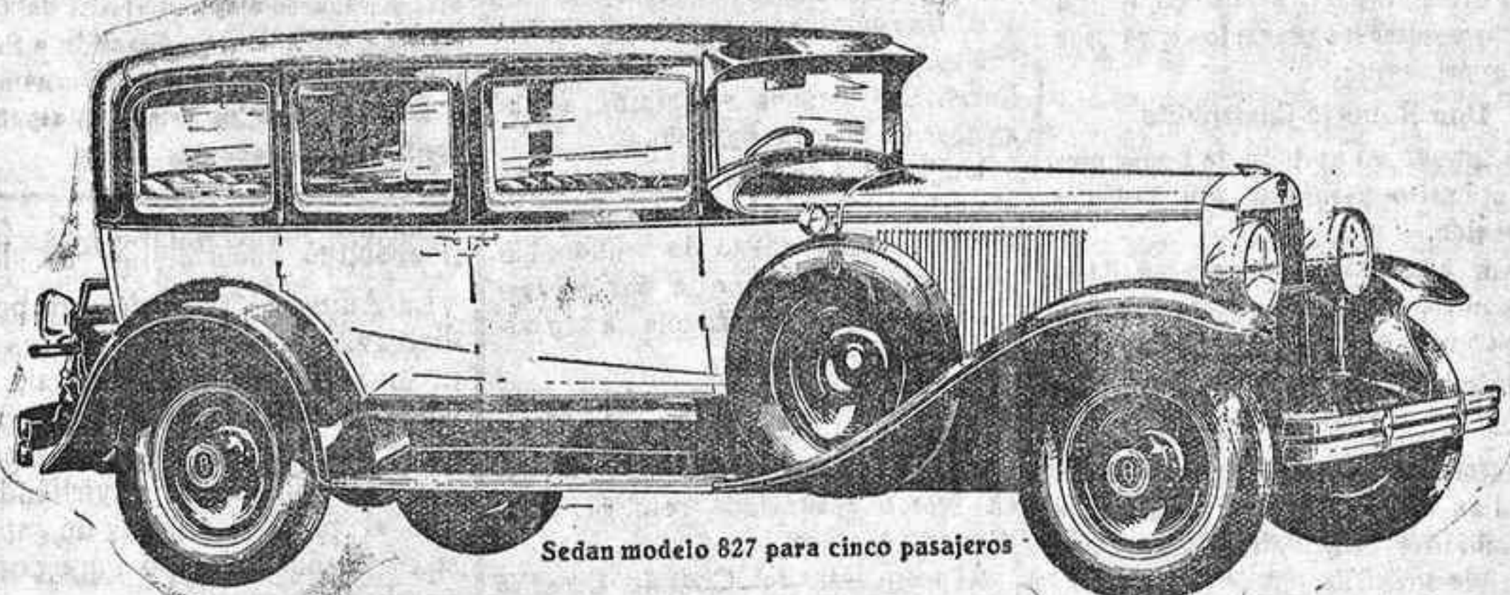
Sedan modelo 827 para cinco pasajeros

de seis y ocho cilindros con transmisión de cuatro velocidades