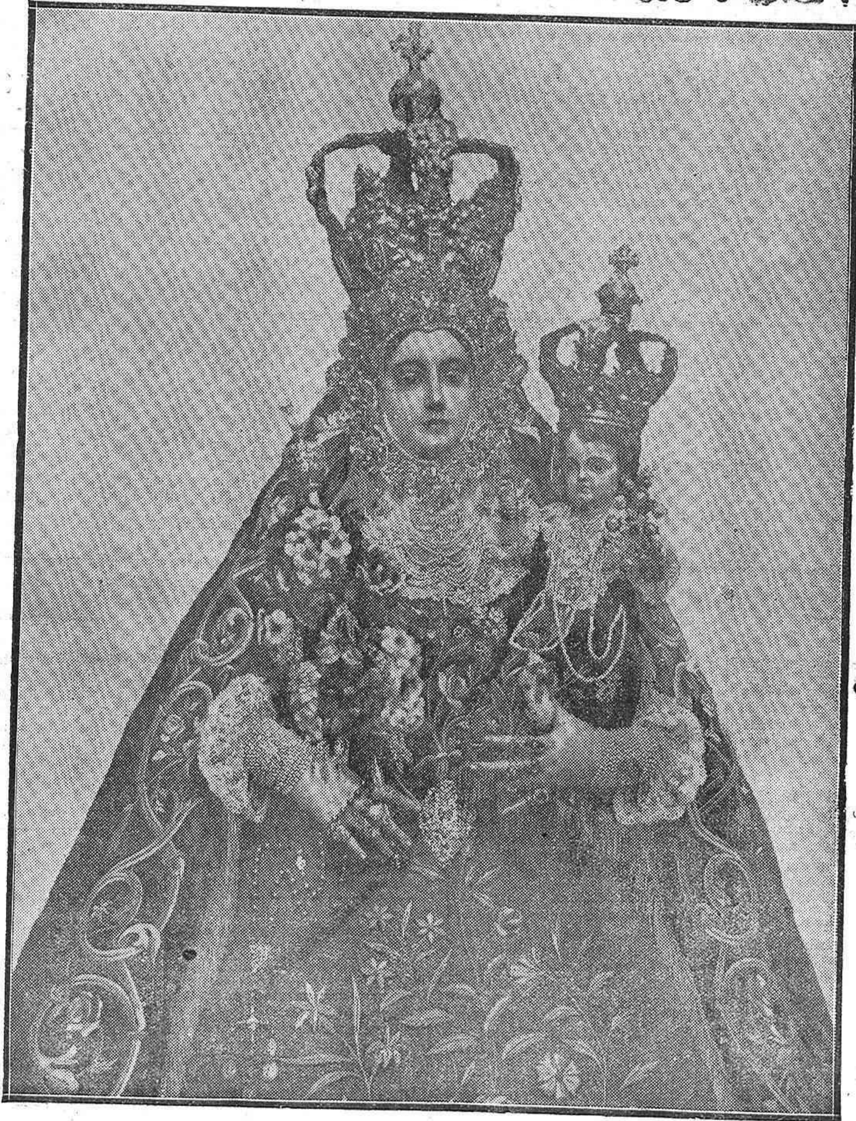
LA EXCELSA PATRONA DE LUCENA.—La venerada imagen de Nuestra Señora Santísima de Araceli, Patrona de Lucena, a, quien los luceninos tienen la más ferviente de las devociones y bajo cuya gloriosa advocación se celebra la renombrada feria de la hermosa ciudad cordobesa.