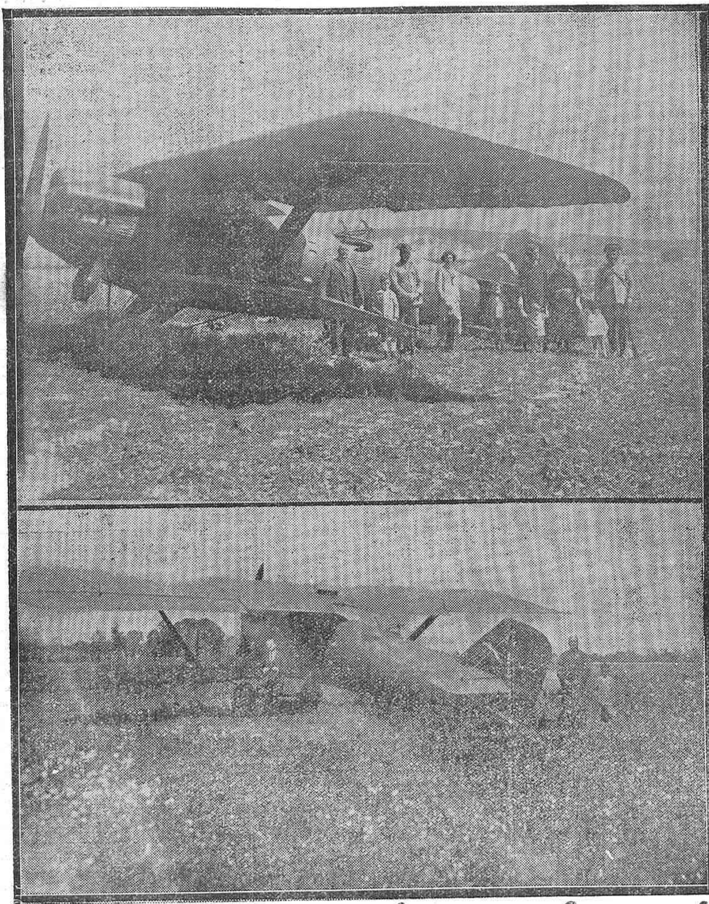
Dos aspectos del avión de bombardeo número 28, que a consecuencia de una avería, ha aterrizado en las inmediaciones de esta capital, en el paraje conocido por «Paso de la Barca».