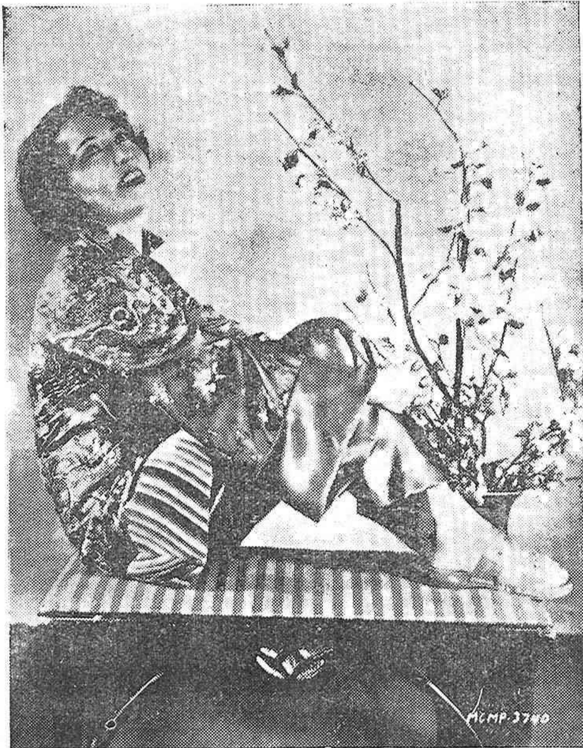
PRIMOROSO KYMONO DE SEDA ESTAMPADA Y SANDALIAS ROMANAS, QUE ESTÁN HACIENDO FUROR ENTRE LA GENTE BIEN DE PARIS.

Llegó: el nuevo surtido en cortes de traje para caballero en colores moda, negro y marino, en El Metro y sus Sucursales.