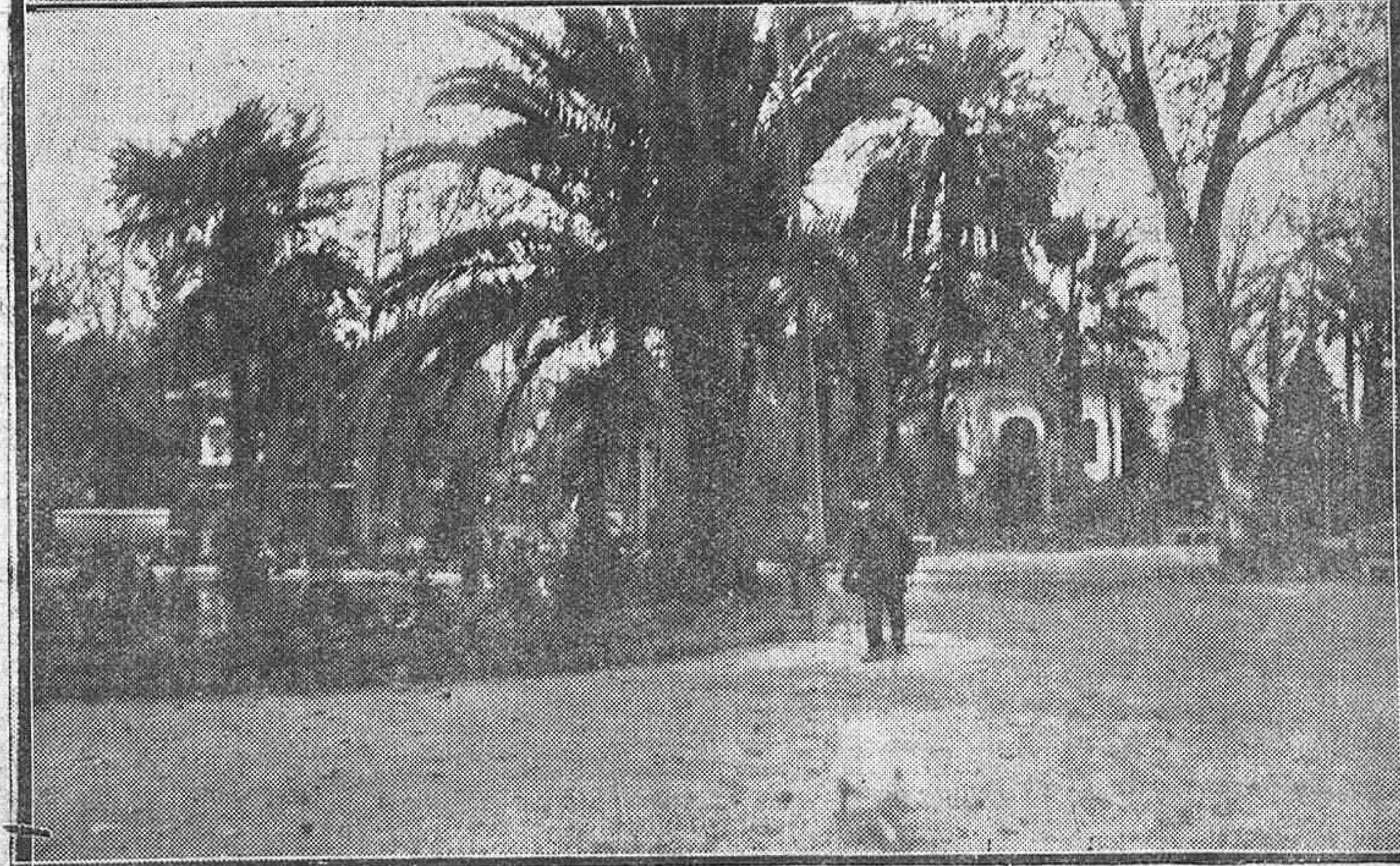
La Avenida de Cervantes, magnífica vía cordobesa, después de terminadas recientemente las obras de pavimentación.—Jardines de la Agricultura, uno de los más populares paseos cordobeses, donde se realizan interesantes mejoras.