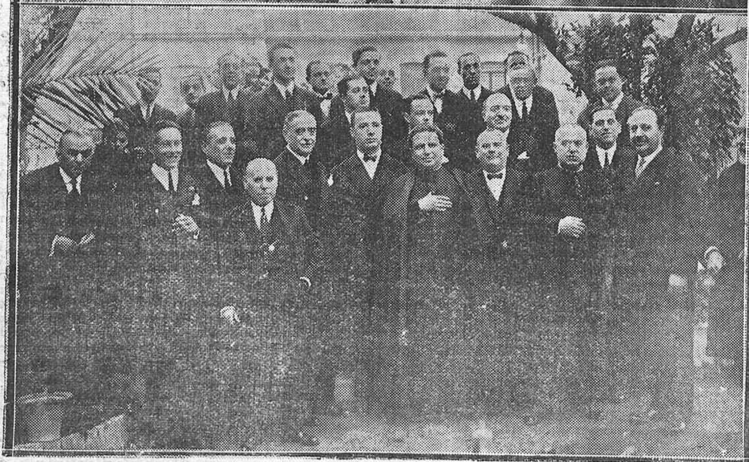
Inauguración del nuevo comedor en el Cuartel del Regimiento de la Reina.—La fiesta de los Abogados. Letrados que asistieron a la función religiosa y banquete.