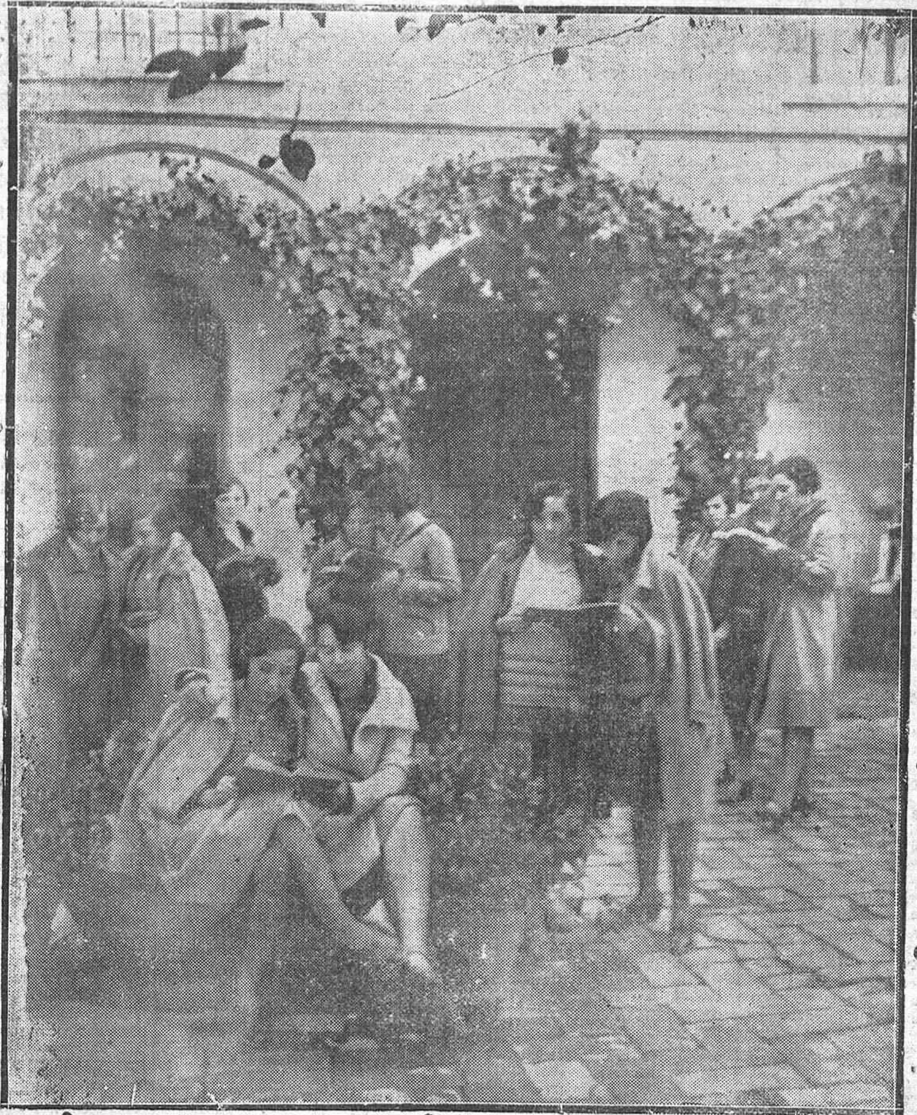
EN LA NORMAL DEMAESTRAS.—Un grupo de normalistas dando el "último repaso" antes de entrar en clase.