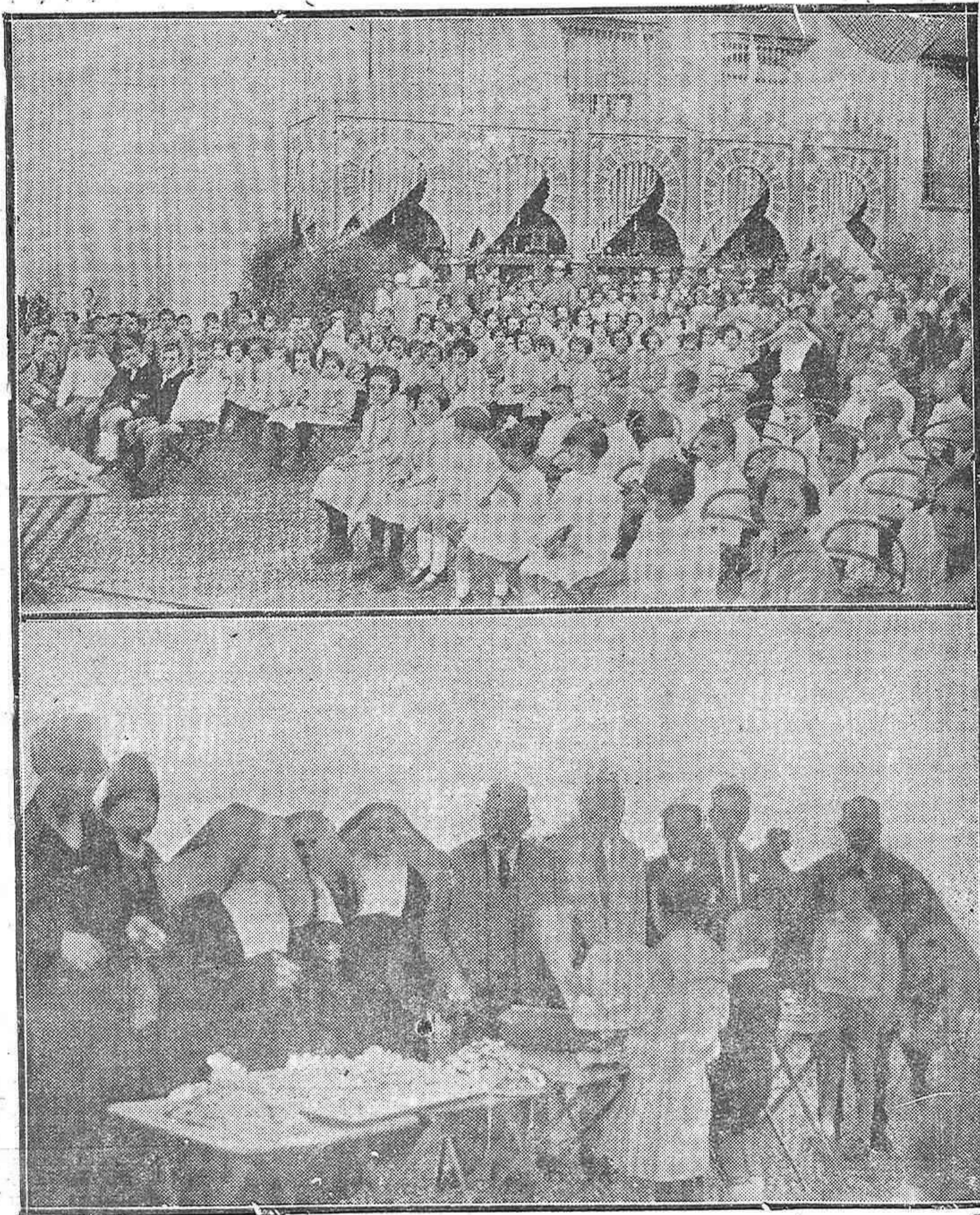
ACTO SIMPATICO.--Con el producto de la tómbola benéfica se entrega en el Triunfo a los niños de las Escuelas Nacionales del barrio de la Catedral y asilados, diplomas y cartillas del Ahorro Postal.—La Junta de la Virgen de los faroles en el acto de entregar los diplomas y cartillas del Ahorro.