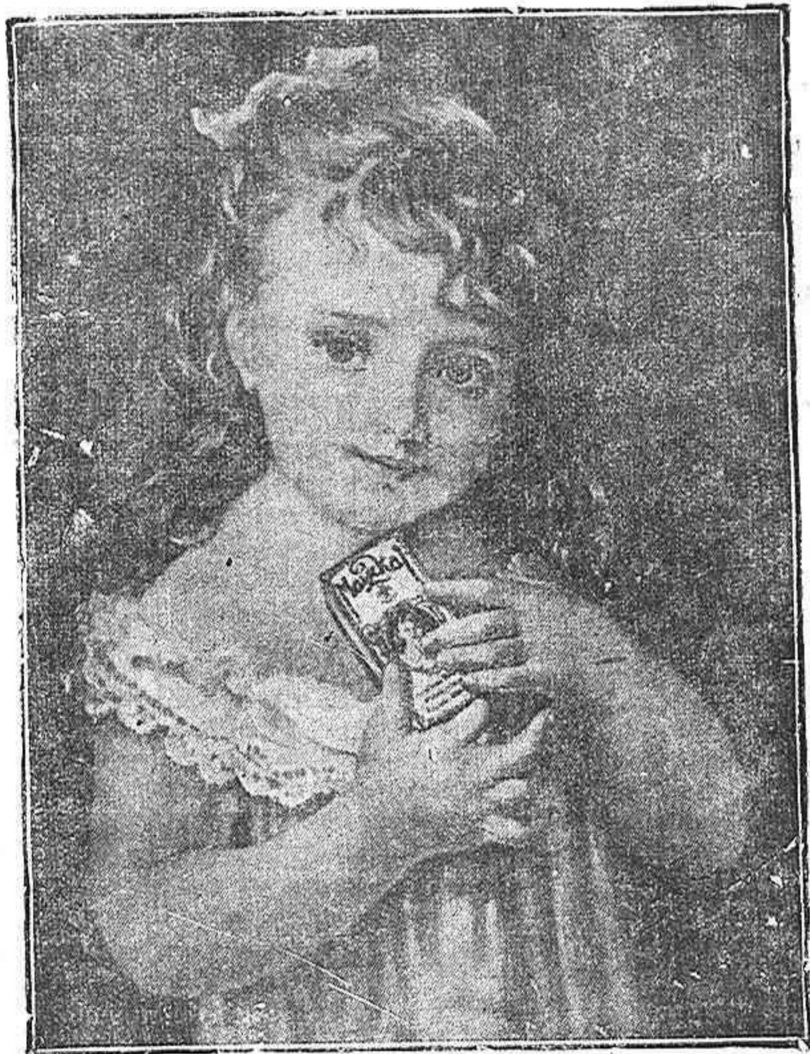
“La niña del Maizkal”