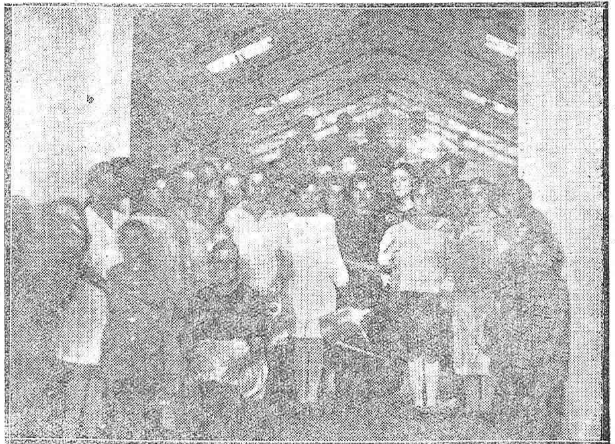
PEÑARROYA-PUEBLONUEVO.—INTERESANTE GRUPO DE LAVANDERAS AL TERMINAR SU HIGIÉNICO TRABAJO EN LOS NUEVOS LAVADEROS CONSTRUIDOS POR EL AYUNTAMIENTO EN BENEFICIO DEL PUEBLO.

SEÑORAS: El flujo y enfermedades de la matriz se curan con las irrigaciones del Doctor Valley USADLAS POR HIGIENE Y PARA EVITAR CONTAGIOS