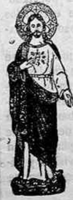
Imágenes y Via-Crucis de las mejores marcas de Olot, modelos exclusivos para este país, y se venden a precios de fábrica, artículos religiosos y objetos plata menues. Encajes para Altares y Albos, galones, flecos, puntillas, borlas, hilos y canutillos de oro y plata, grandes surtidos. Antonio Zafra LETRADOS, 20