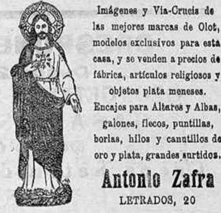
Imágenes y Via-Cruces de las mejores marcas de Olot, modelos exclusivos para esta casa, y se venden a precios de fábrica, artículos religiosos y objetos para altar meneses.

Los precios libres para el entrador, son: De 3'01 a 3'02 para el ganado vacuno; a 3'60, para el de terneras; a 2'20 para lanar y cabrio.