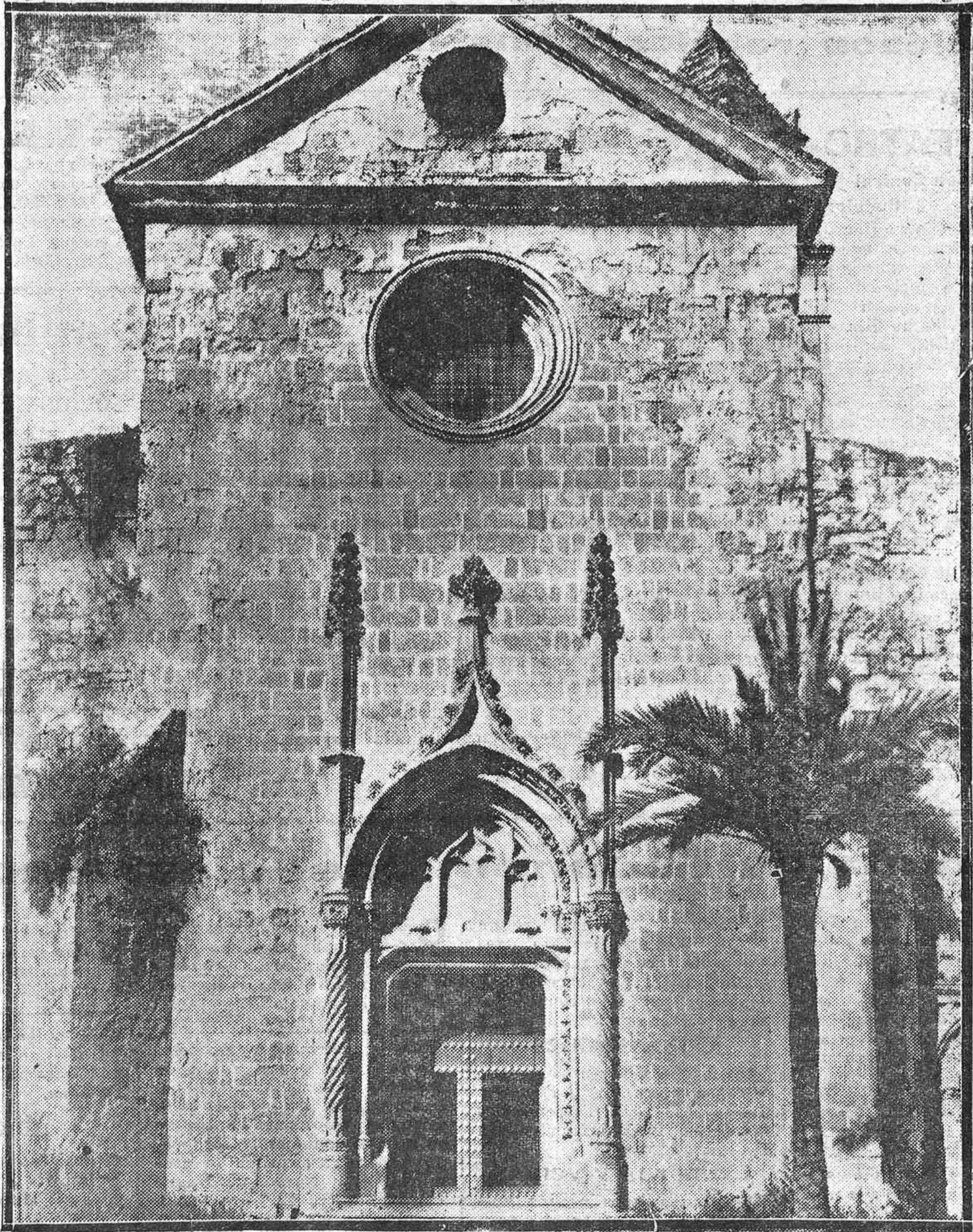
MONUMENTOS CORDOBESES.—Portada del Monasterio de San Jerónimo. Obsérvese el maridaje del estilo gótico florido con las columnas salomónicas.