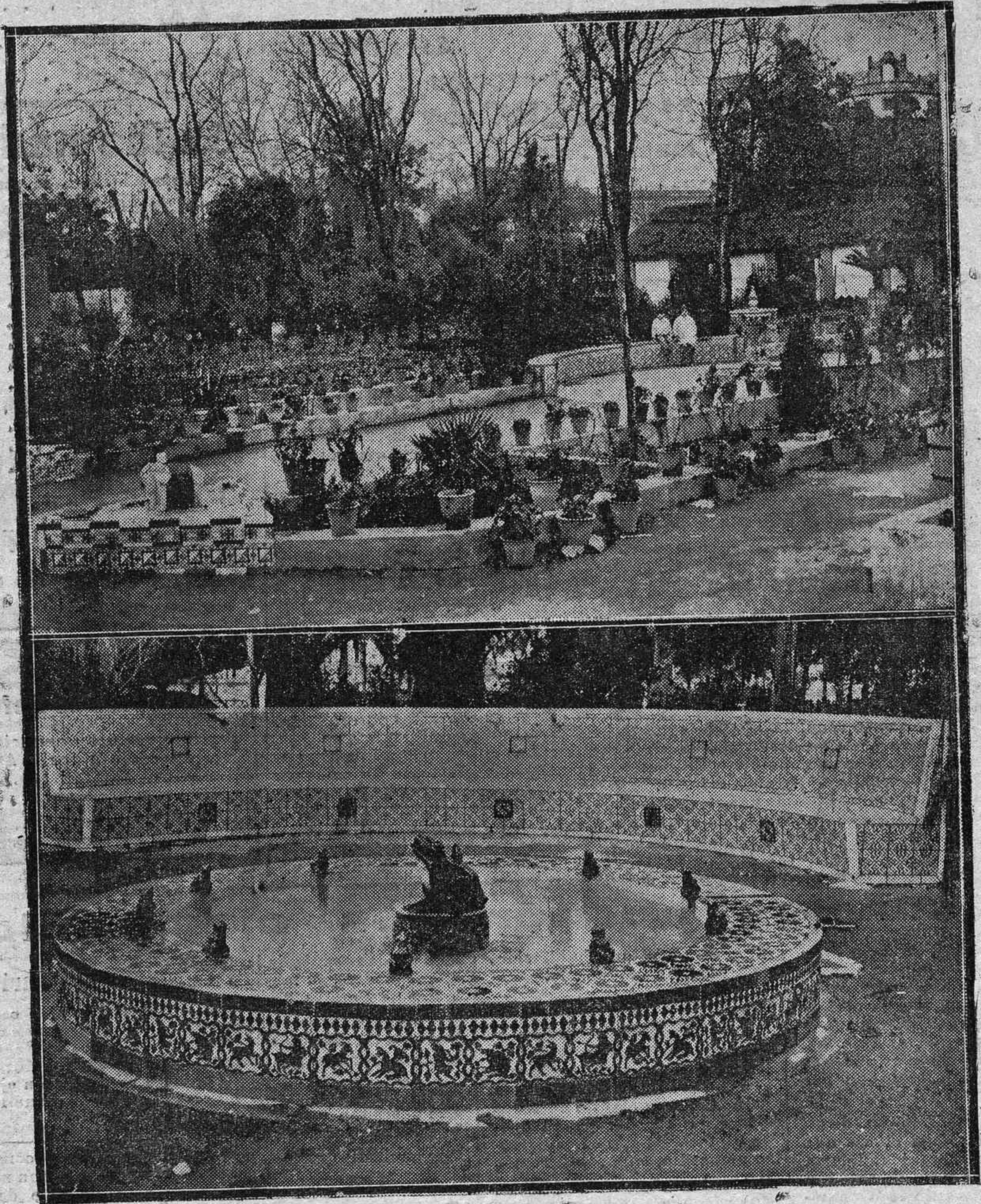
EN LOS JARDINES DE LA AGRICULTURA.—Dos bellos rincones.