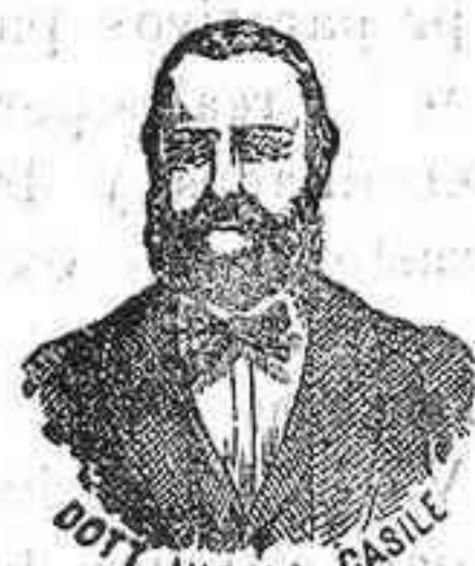
Inventor de los renombrados medicamentos CASILE