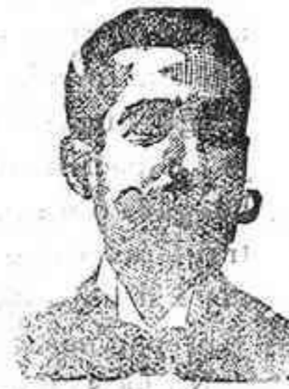
Inventor de los renombrados medicamentos COSTANZI

GONDOMAR, 7 Antiguo local de la Fonda Simón CORDOBA