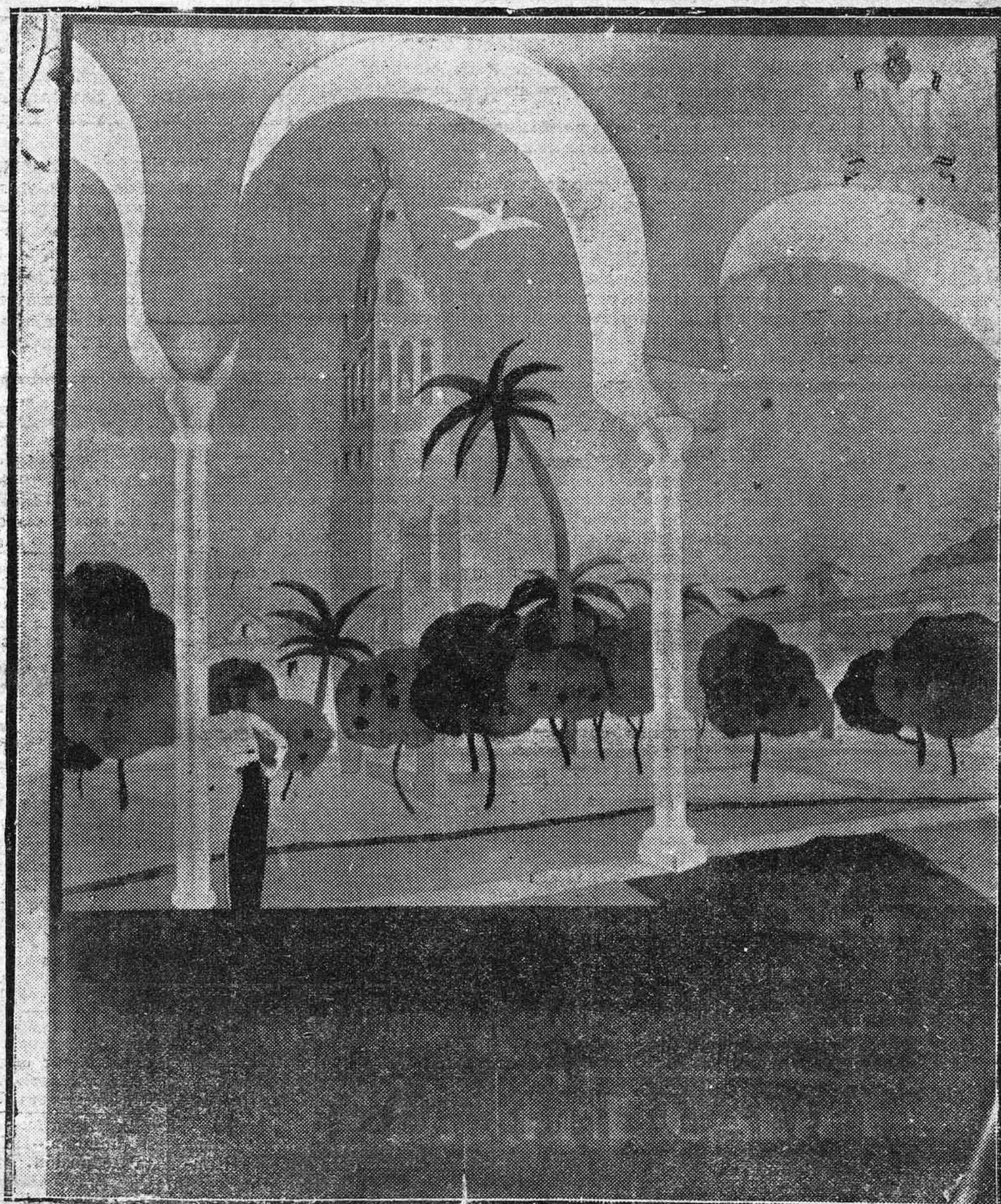
Bellísimo cartel de Córdoba, de propaganda turística, editado por el Patronato Nacional de Turismo.