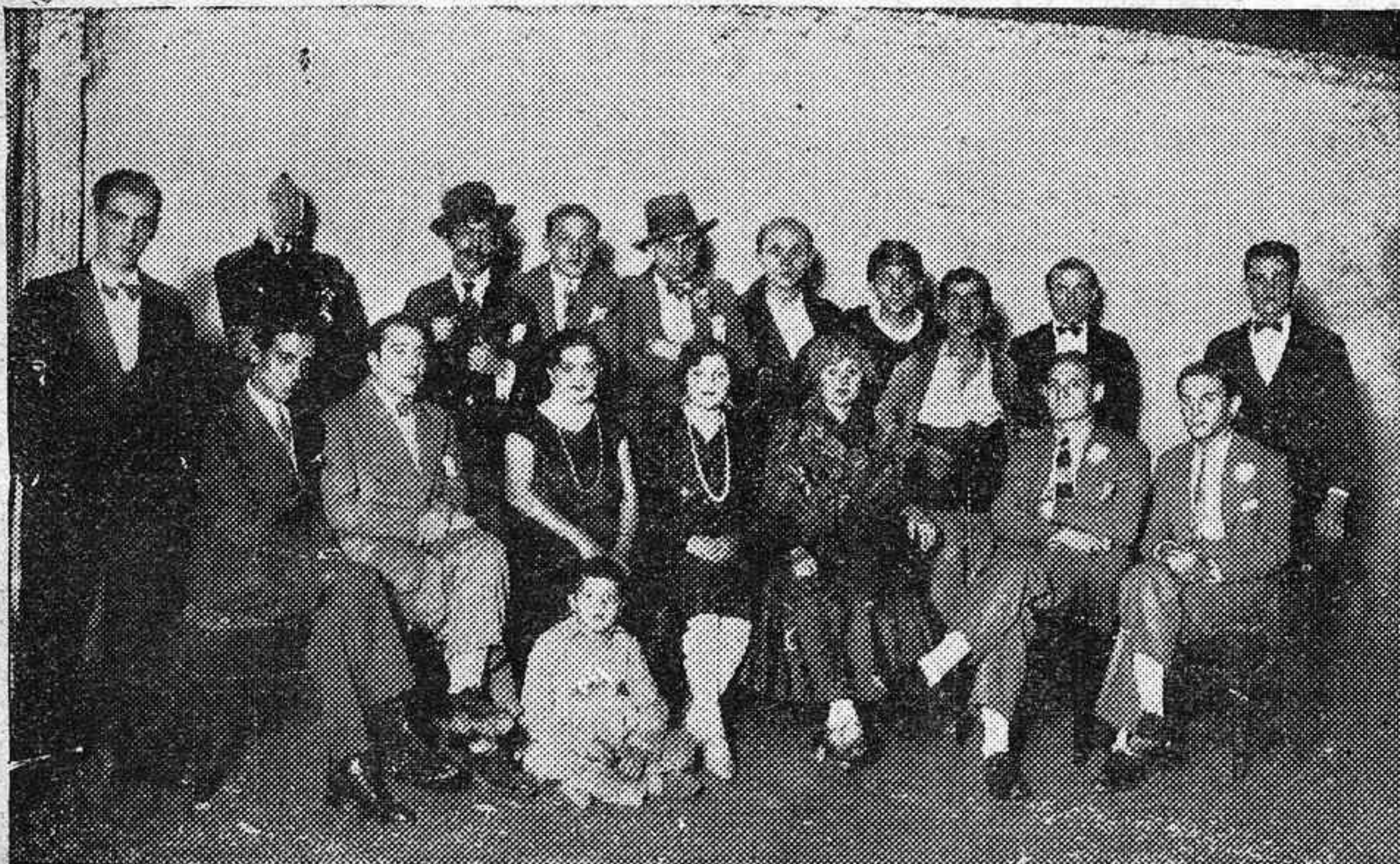
EL FESTIVAL BENEFICO DE ANOCHE.—DISTINGUIDOS JÓVENES QUE TOMARON PARTE EN EL FESTIVAL CELEBRADO EN EL TEATRO DE SAN LORENZO A FAVOR DE SERRANITO.