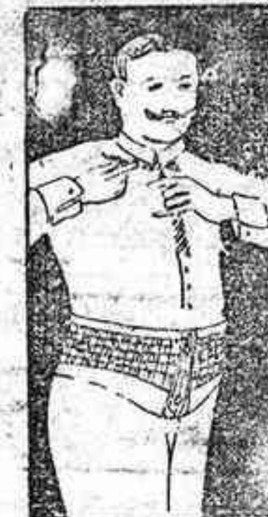
FAJA DE CABALLERO