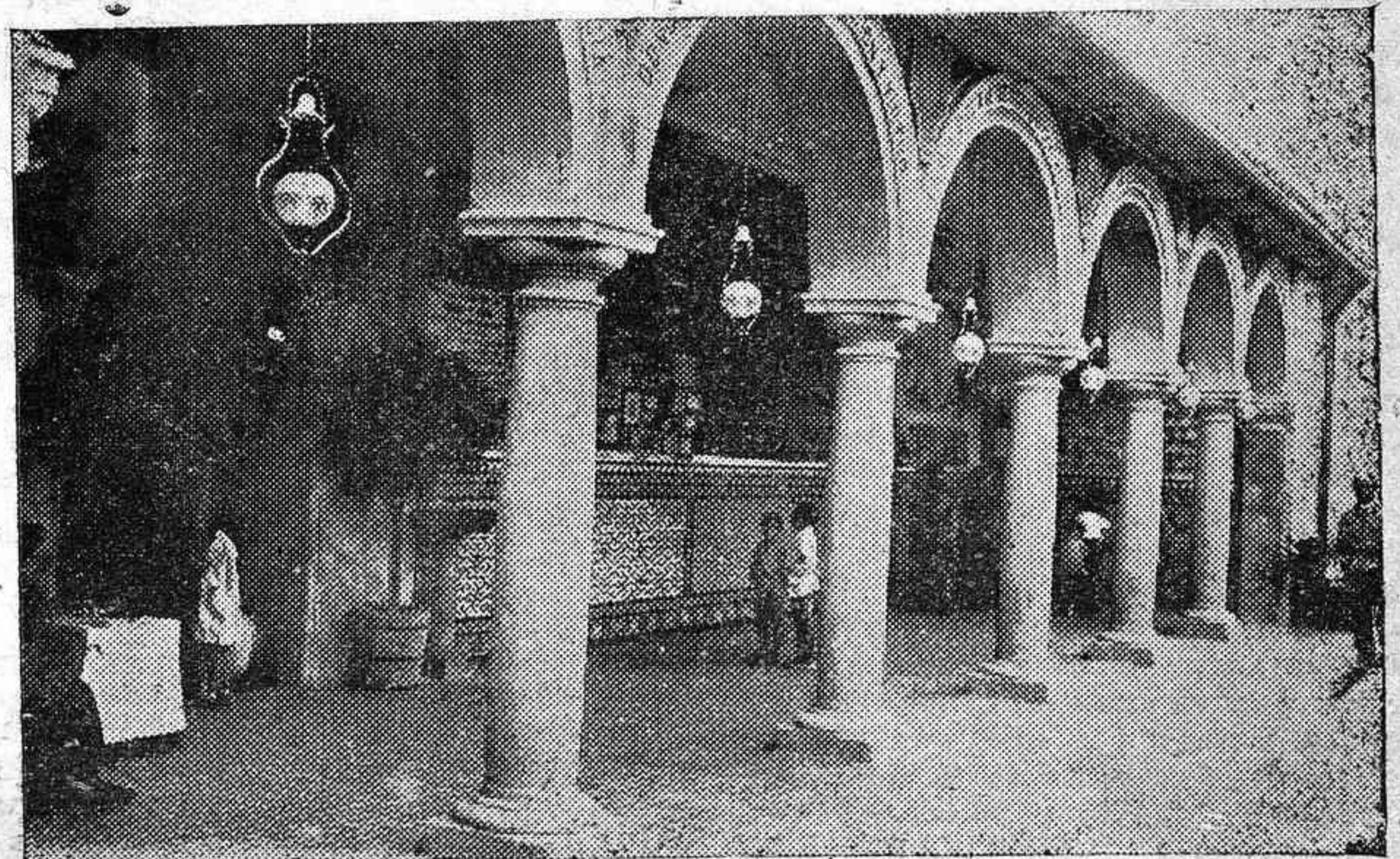
GALERÍA DE LOS MILAGROS EN EL SANTUARIO DE LA FUENSANTA.