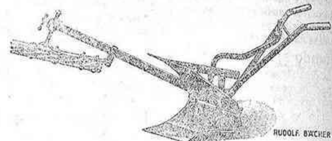
Arado YRUÑA Bacher

Nuestros semi-brabant YRUÑA, jiratorio, JABATO y modelo AMAYA de vertedera fija y timón por bajo, resisten victoriosamente todas las competencias. Rejas para arado JABATO grande, forjadas y estampadas sin taladrar, pías, 9-20 pulgadas fundidas . . . . . taladradas . . . . .