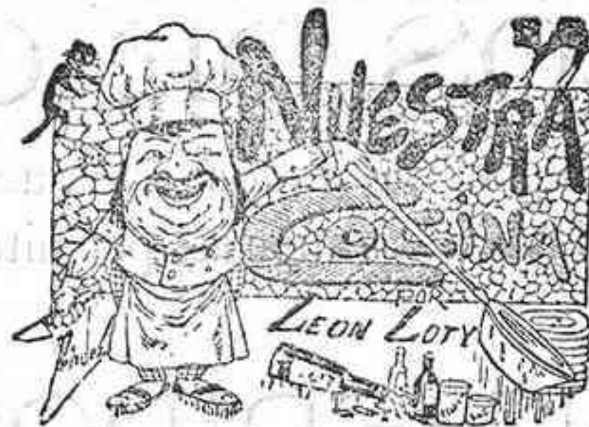
Comidas para el 29 de Diciembre

—El domingo 31 del corriente y los días 1 y 6 de Enero próximo, continuarán las misas de aginaldo en la iglesia de San Rafael.