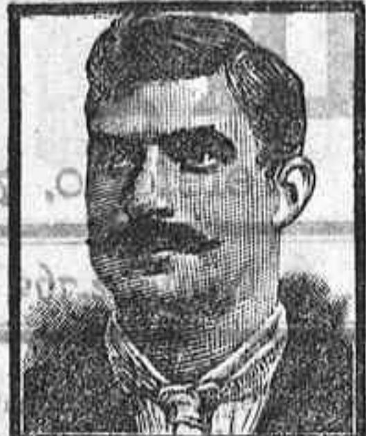
Tarrasa, Calle Media Pasco 46, 8 Marzo 1908.