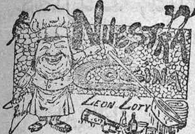
Comidas para el 6 de Julio

El duelo se recibe y despide en la Iglesia.