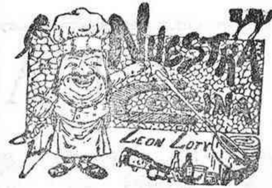
Comidas para el 22 de Septiembre

—Mañana á las diez se celebrará en la iglesia del hospital de San Jacinto la fiesta solemne que todos los años dedica el Colegio de Procuradores de esta capital á su patrona Ntra. Sra. de los Dolores.