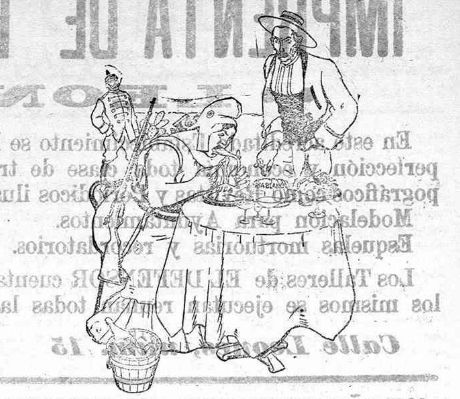
Entre dos que bien se quieren, con uno que coma basta. (De Hojas Selectas)