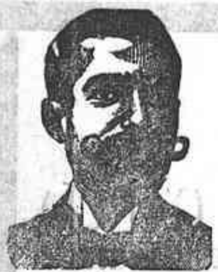
Inventor de los renombrados medicamentos.