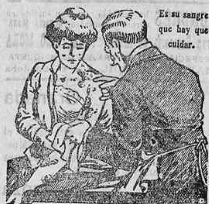
Es su sangre que hay que cuidar.