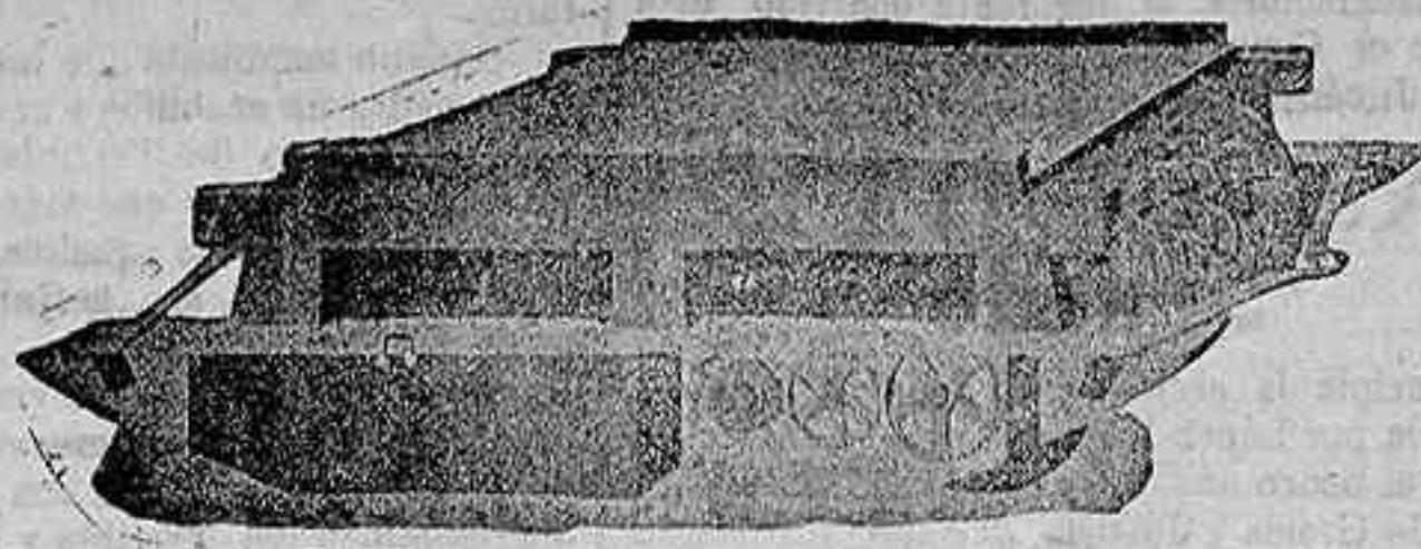
TRILLO ROTATIVO DE GRAN TRABAJO para una sola yunta de mulos.