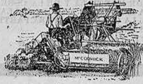
Afiadoras Macormick — ULTIMA PERFECCION —