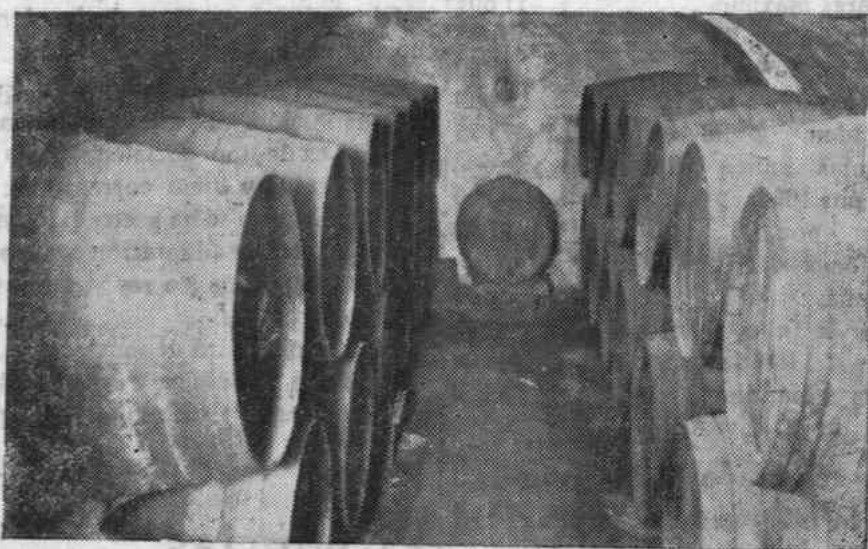
Primitiva bodega de la Sociedad.

Aunque sus establecimientos ostentan el nombre de Sociedad de Plateros sus clientes pertenecen a todas las clases sociales y en particular el ele