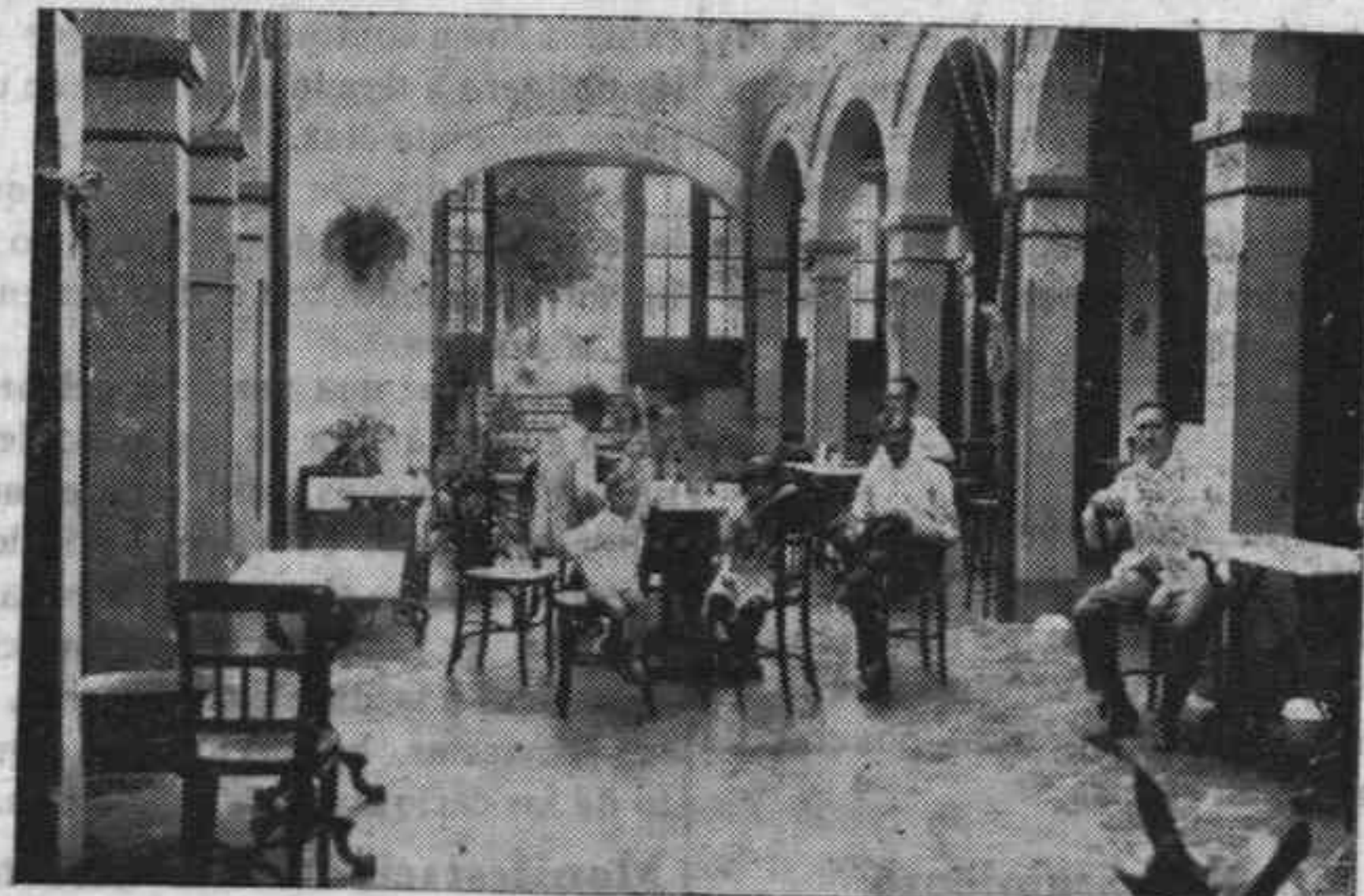
Detalle del patio de la Sucursal de San Lorenzo.