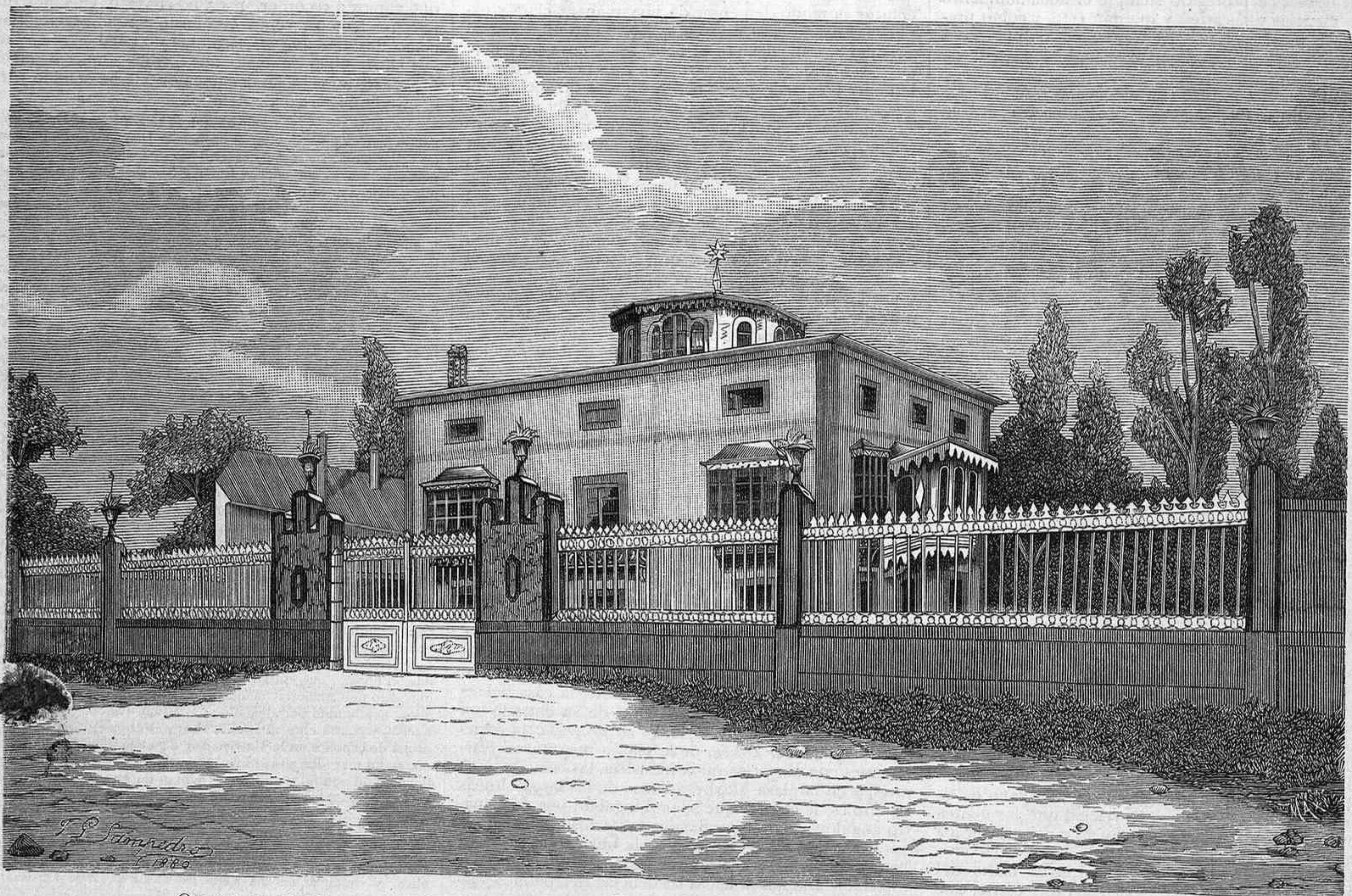
QUINTA DE LOS EXCMOS. SEÑORES MARQUESES DE MUROS, situada en Muros de Pravia. (Dibujo de D. T. G. Sampedro.)