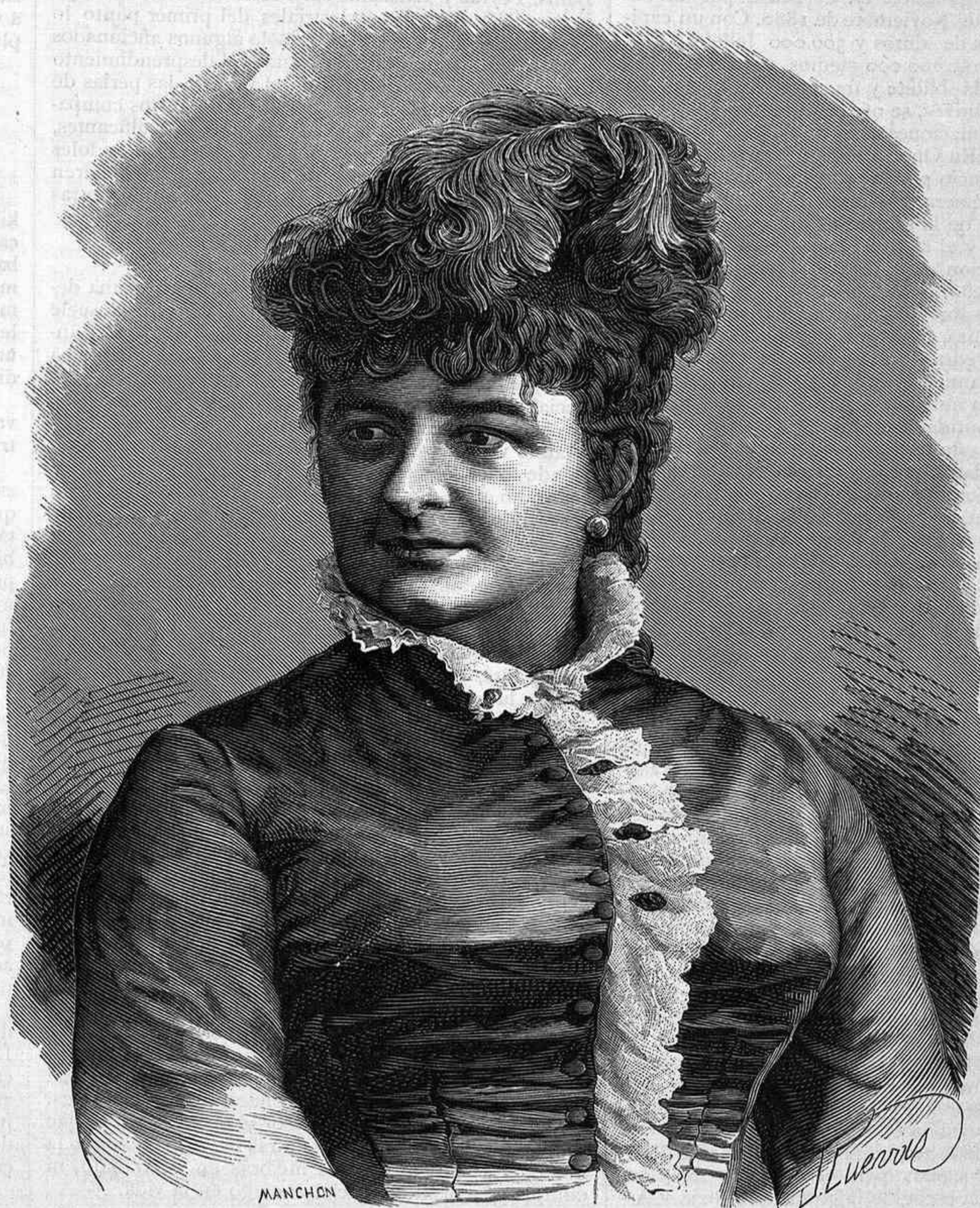
DOÑA EMILIA PARDO BAZAN

Deseando que lleve la expresion de nuestra gratitud y la del país gallego y asturiano, lo hacemos hoy público en esta advertencia.