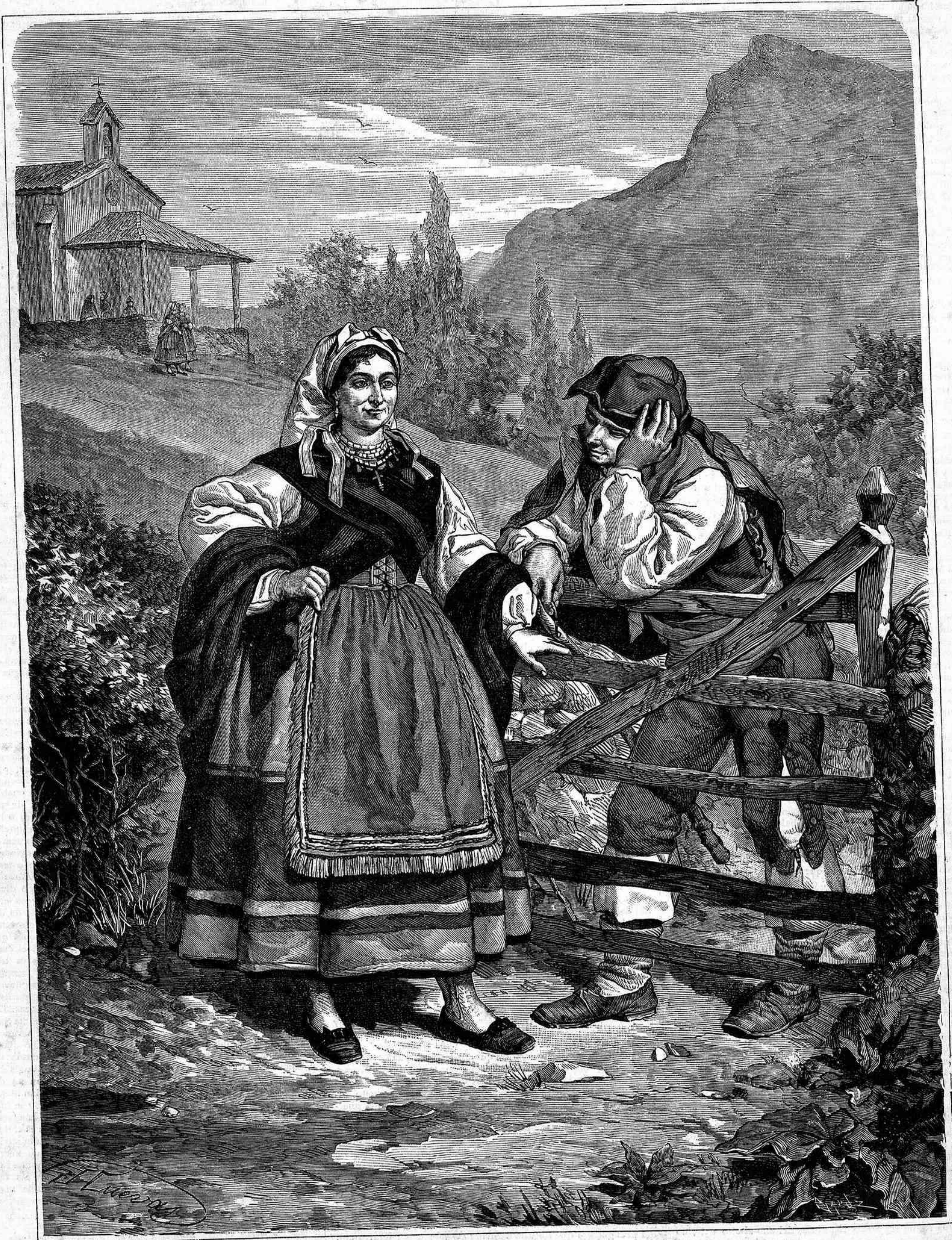
UN PÁRRAFO DESPUES DE LA MISA (Composicion y dibujo de D. Jose Cuevas).