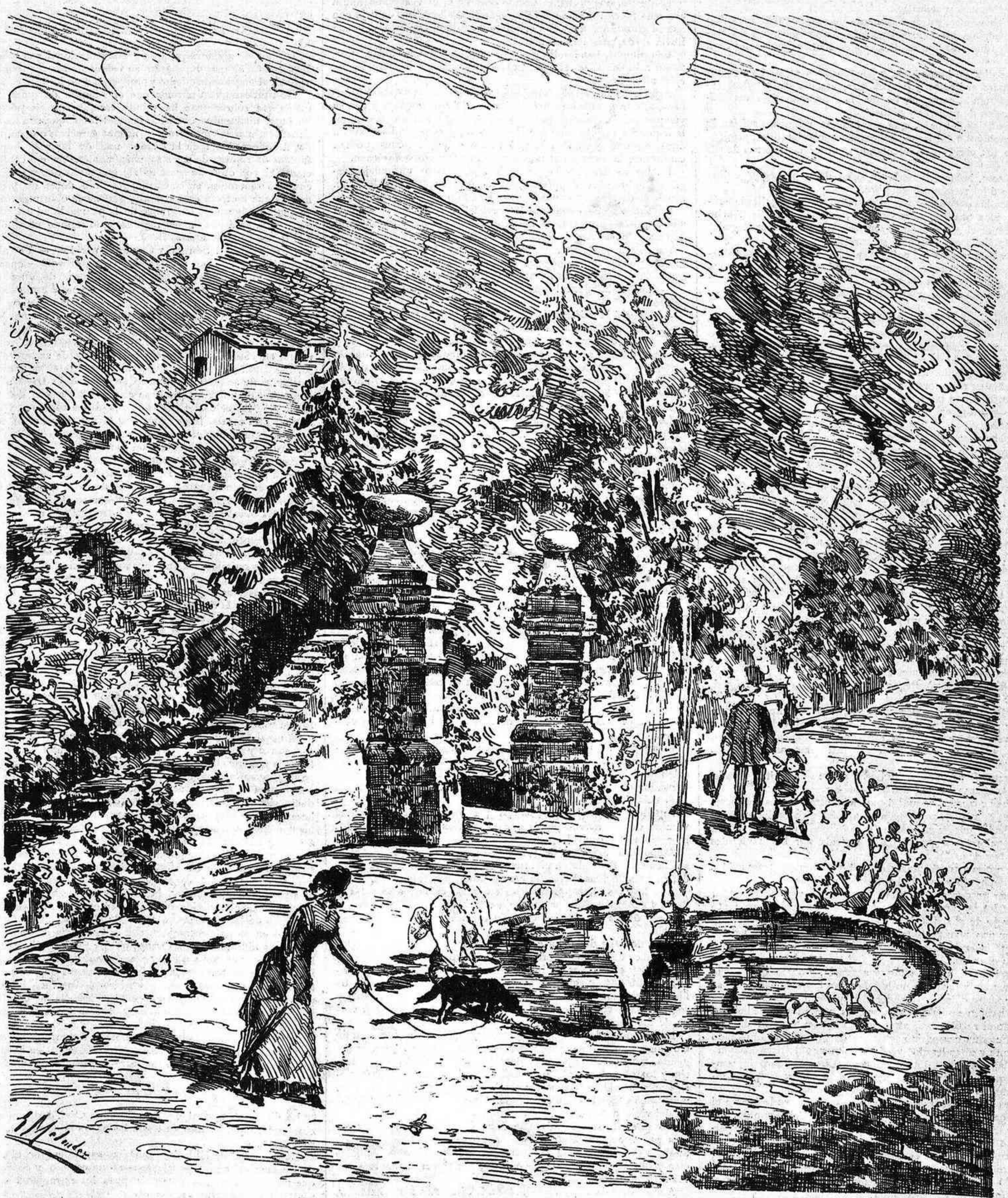
JARDIN Y ANTIGUO MURO DEL CASTILLO DE SOTOMAYOR.