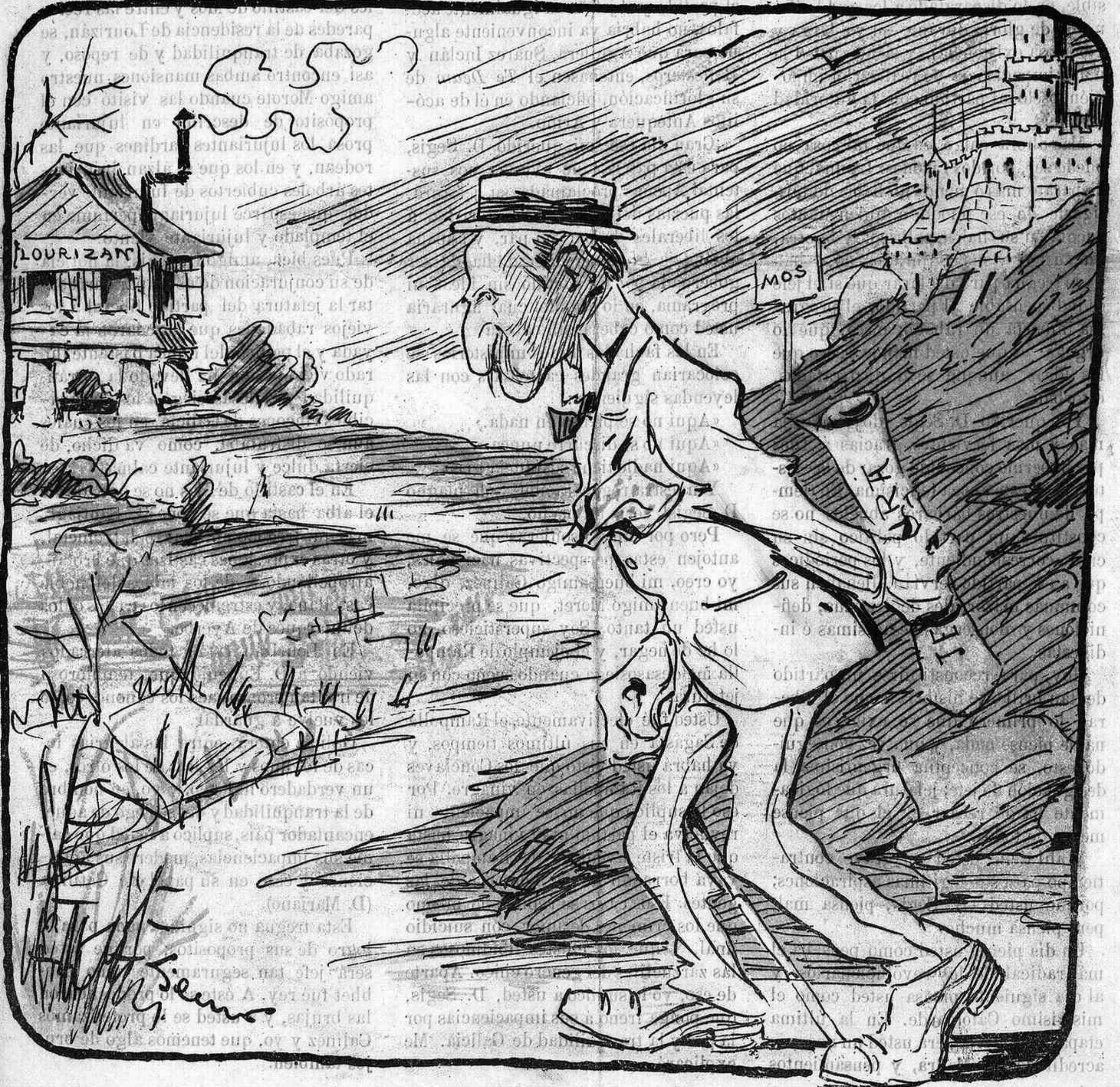
De Ceca en... Mecc