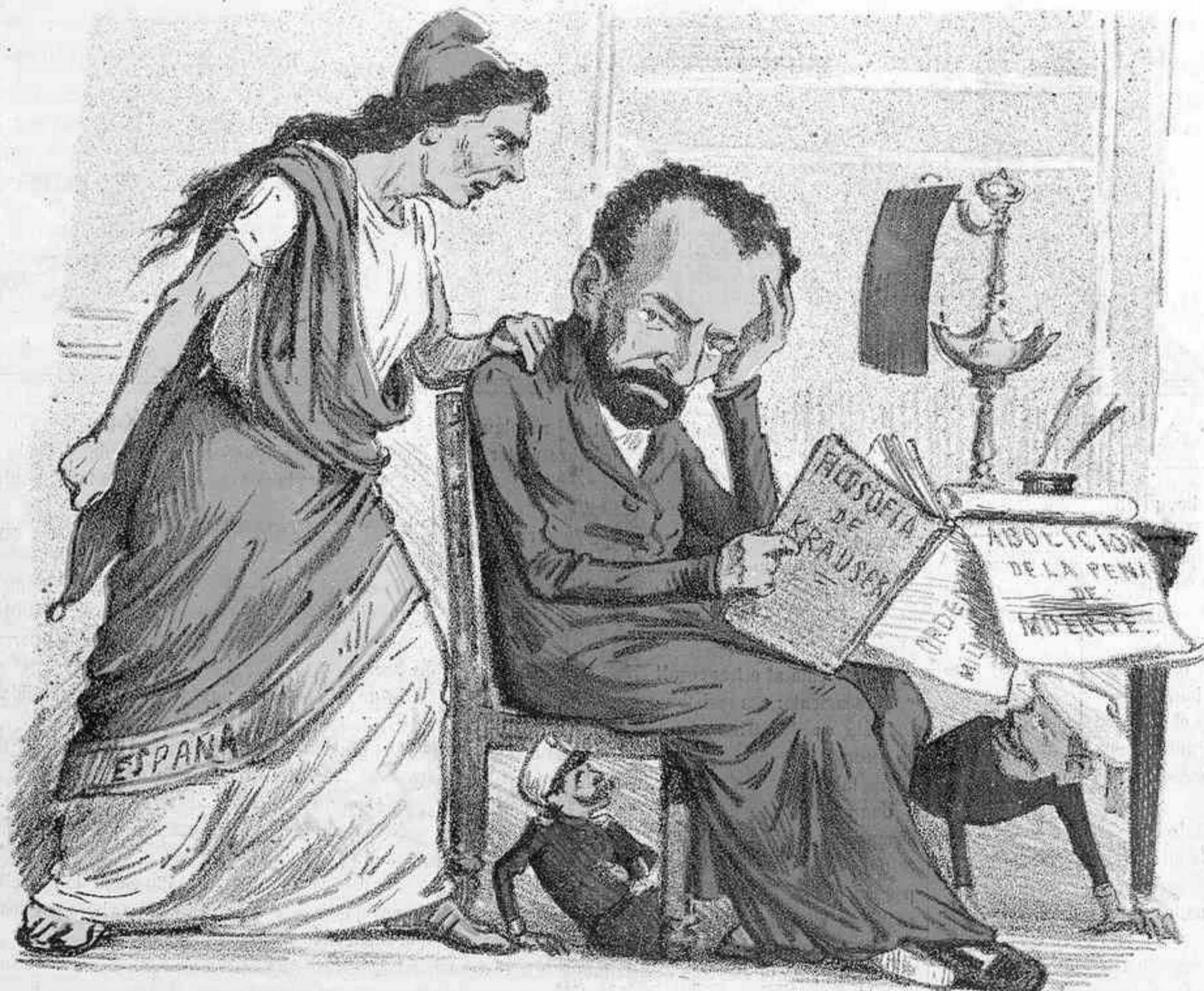
!!! Para filosofías estábamos!!! y se nos quema la casa.