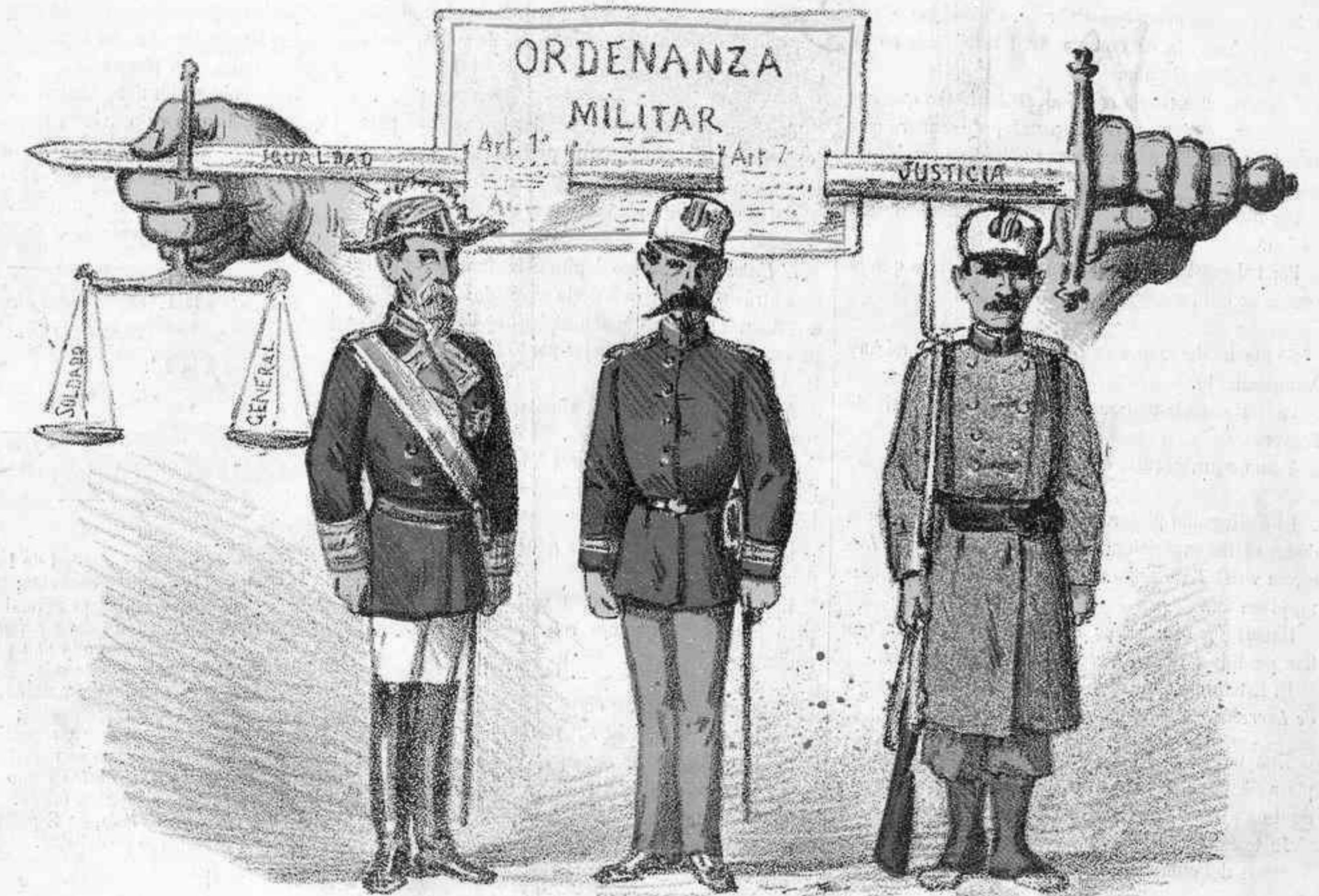
Sea igual para todos.