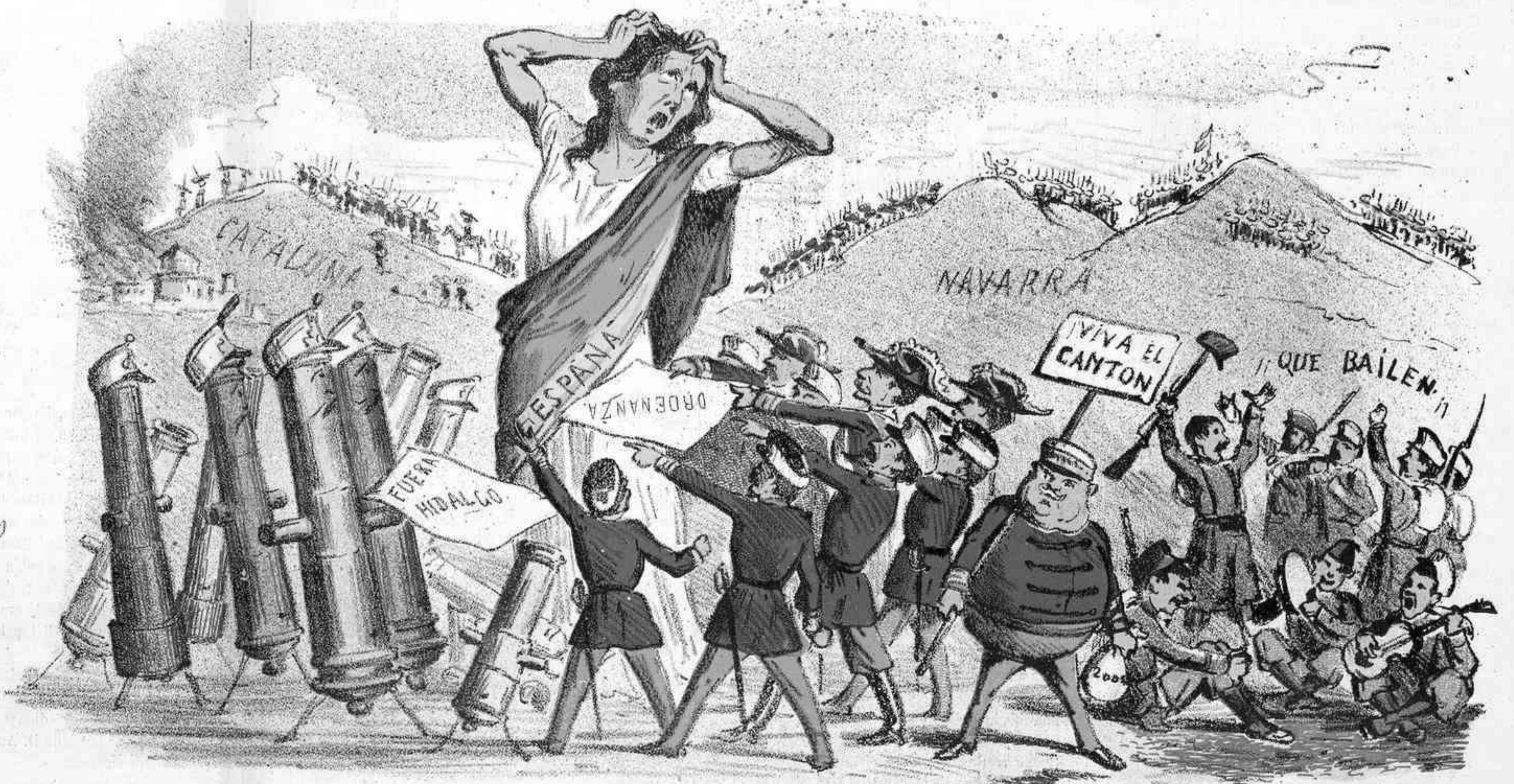
Varios problemas de difícil solución.