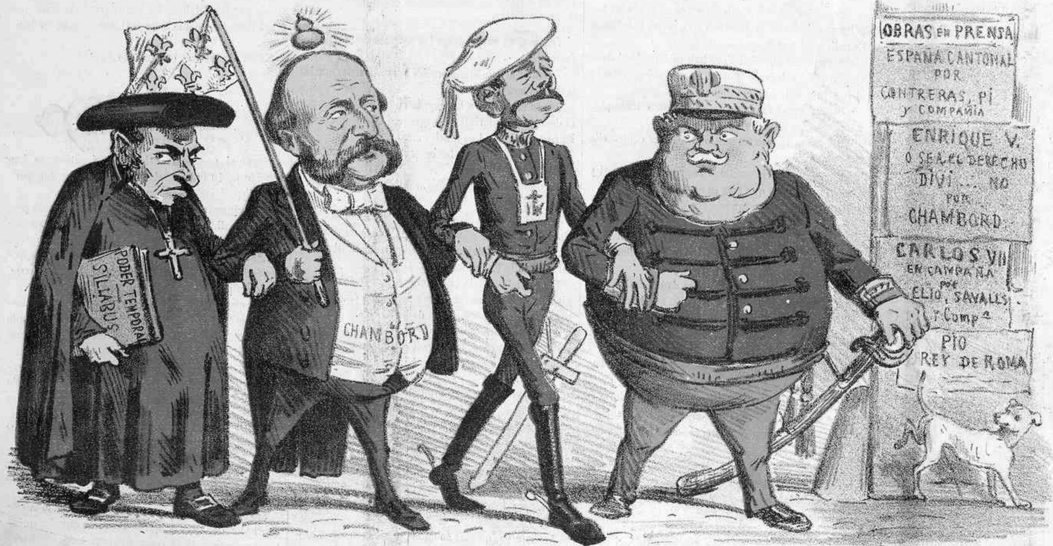
Dios los cria y ellos se juntan.