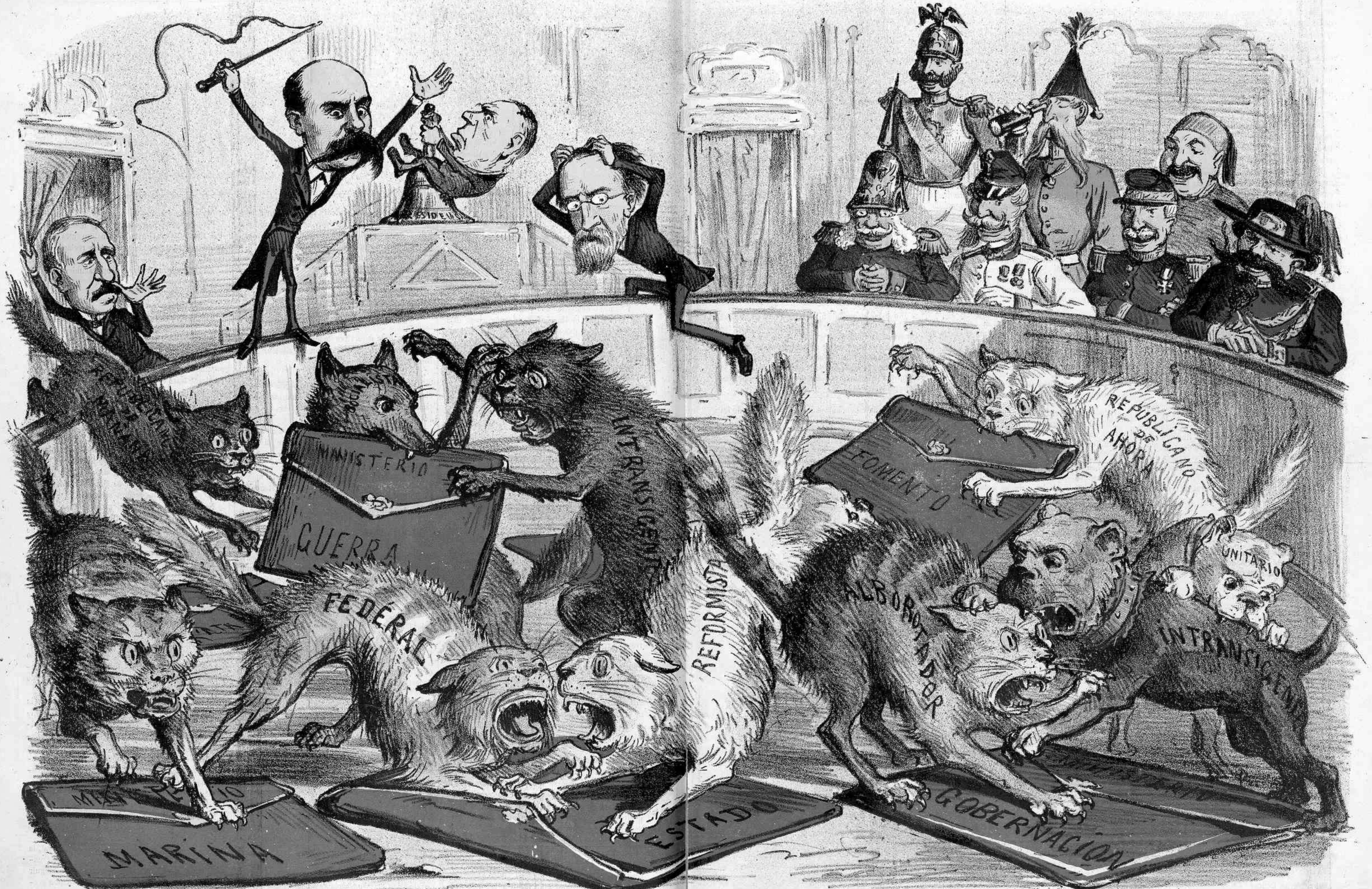
Sesion del 8 Junio. ¡¡¡ Que unión y que Patriotismo!!! ¡¡¡ POBRE PAÍS!!!.