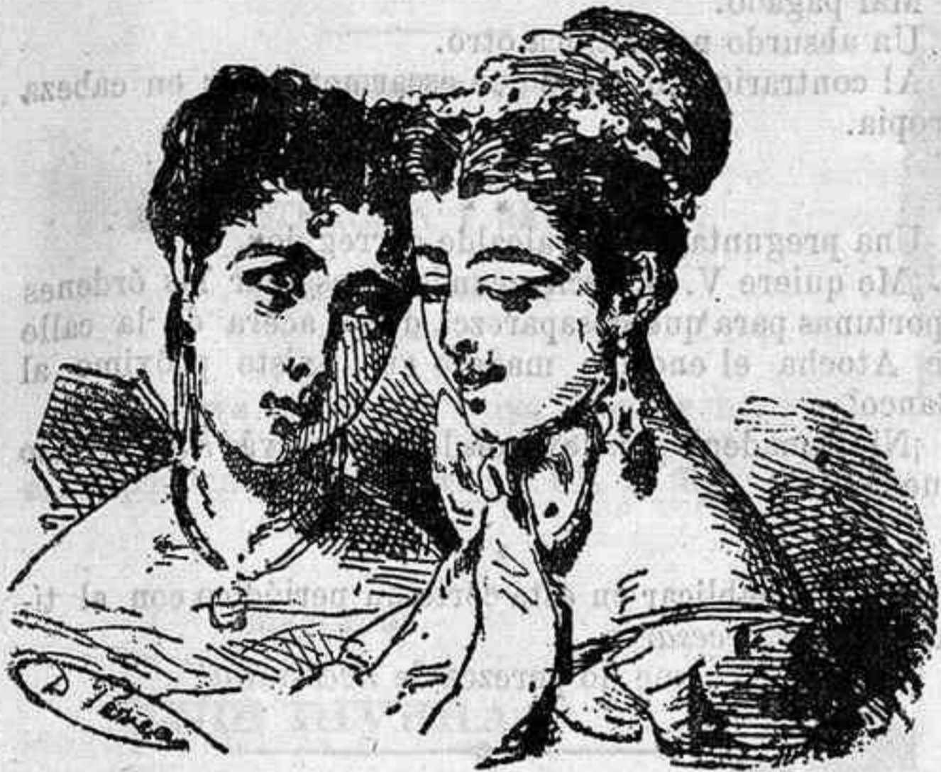
—¿Te gusta Beethoven? —Me gusta más Arturito.