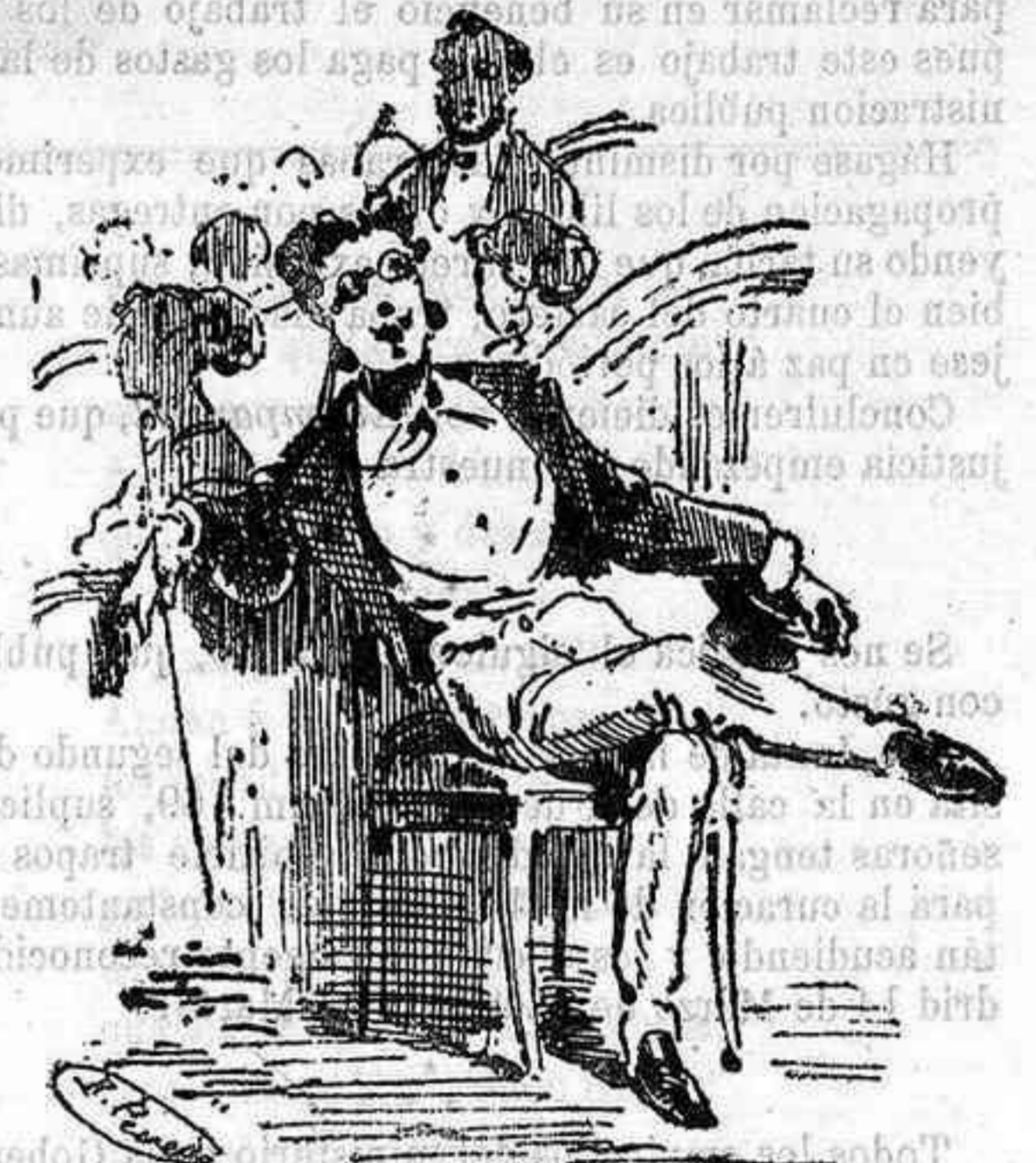
¡Mendelssohn! ¡Obra 4.199! ¡Ah! ¡oh!