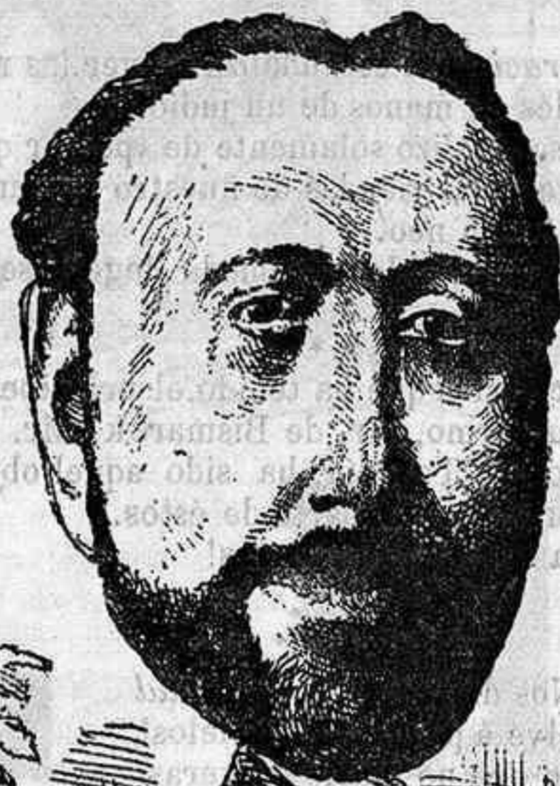
IL MAESTRO DIRETTORE.