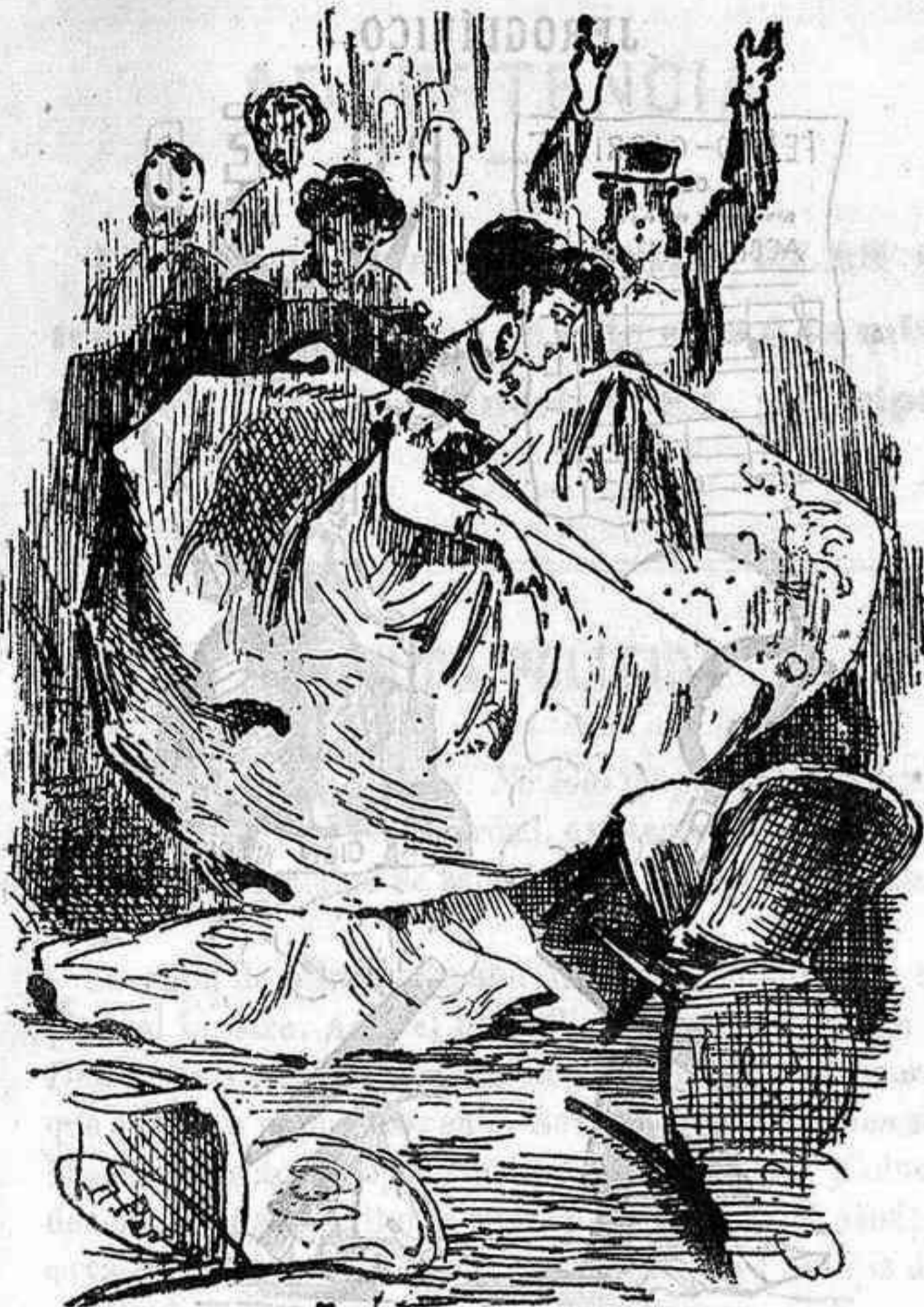
Un desconcierto... en el concierto.