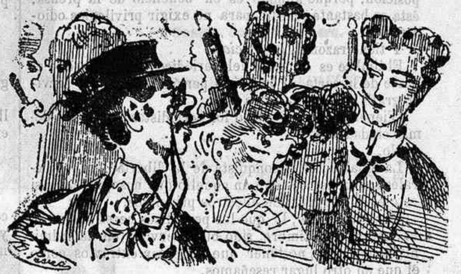
—¡Delicioso! Esto es volar á los cielos, flotar en las nubes... —(De humo. ¡Uf qué peste!)