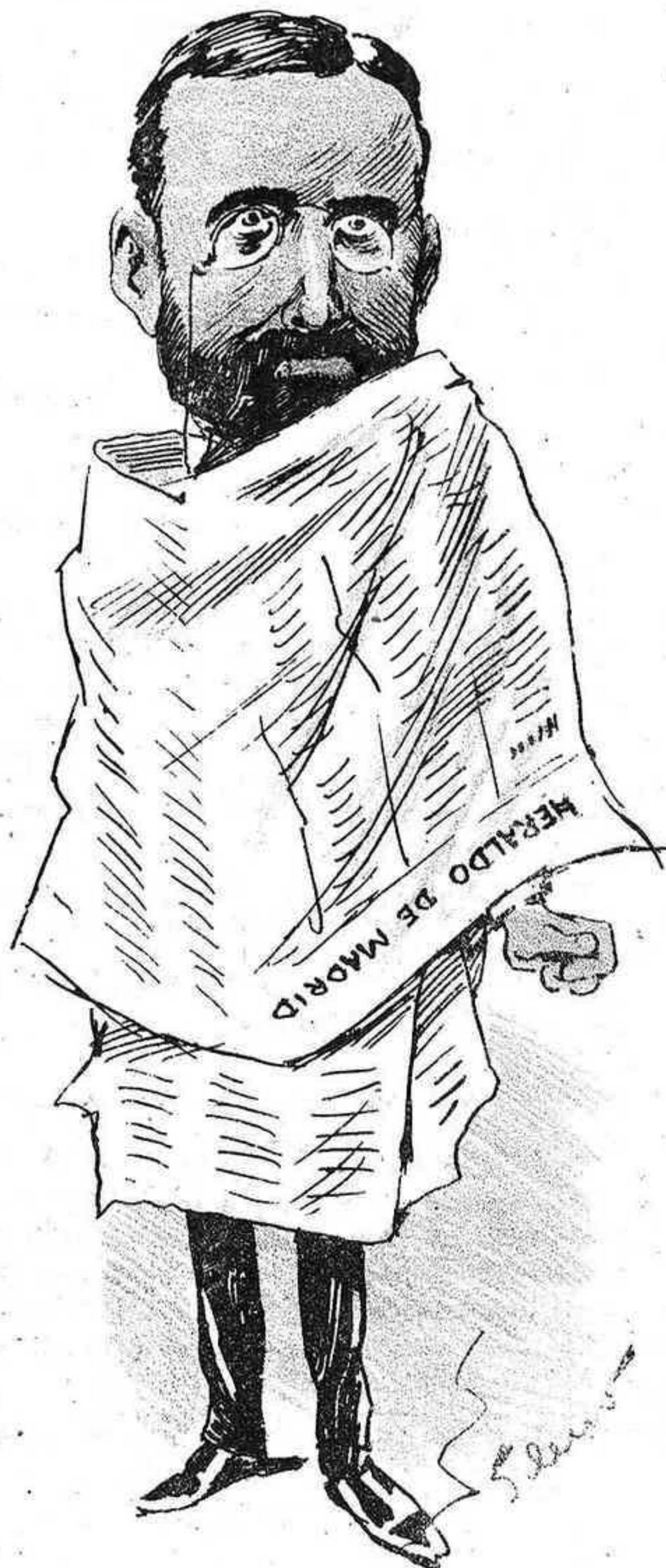
Para los papeles de embobado primeros