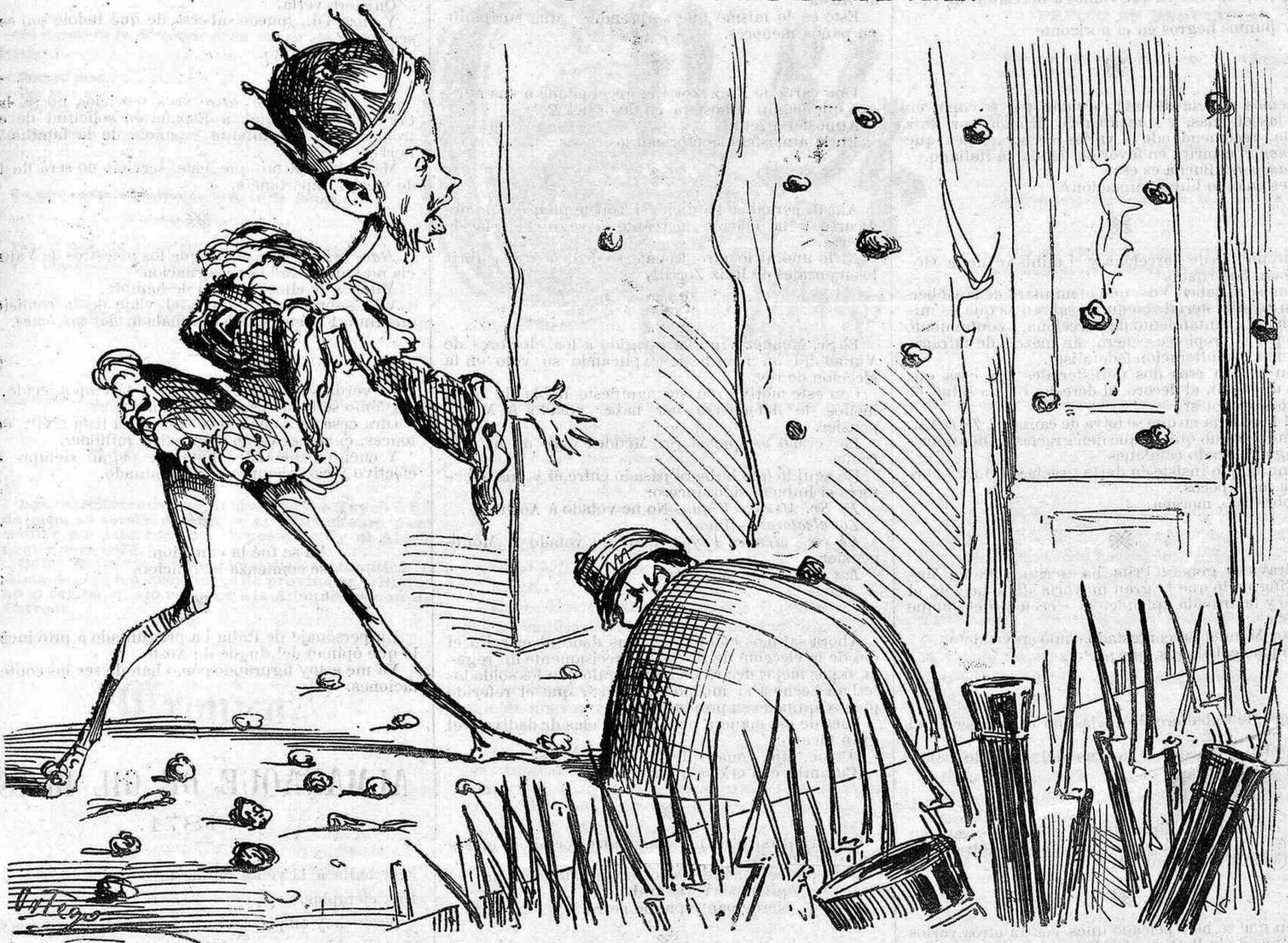
A pesar de lo bien preparada que tienen la orquesta, el primer actor no gusta al público.

—Oh, no son lo que eran. Han decaído mucho. El verdadero país es decididamente partidario de V. A. —¿Y quién es el país? ¿En qué provincia vive? —¿El país? ¿No ha visto V. A. sus nombres en periódicos? Son 191 representantes legales de la opinión, que votaron á V. A. —Decís bien, hijos míos. Vamos á reinar. Ya os daré algo, que ahora no tengo suelto. Acompañadme á la sesuda España, que quiero ser su amparo, su rey tutelar y su ángel constitucional, y espero que me ayudareis á hacer su dicha. —Hasta ahora no hemos hecho otra cosa. Así está ella. —Y confío en vosotros. Si un día peligrase el trono... —Si llega á peligrar... será la última vez. (Vánse.)