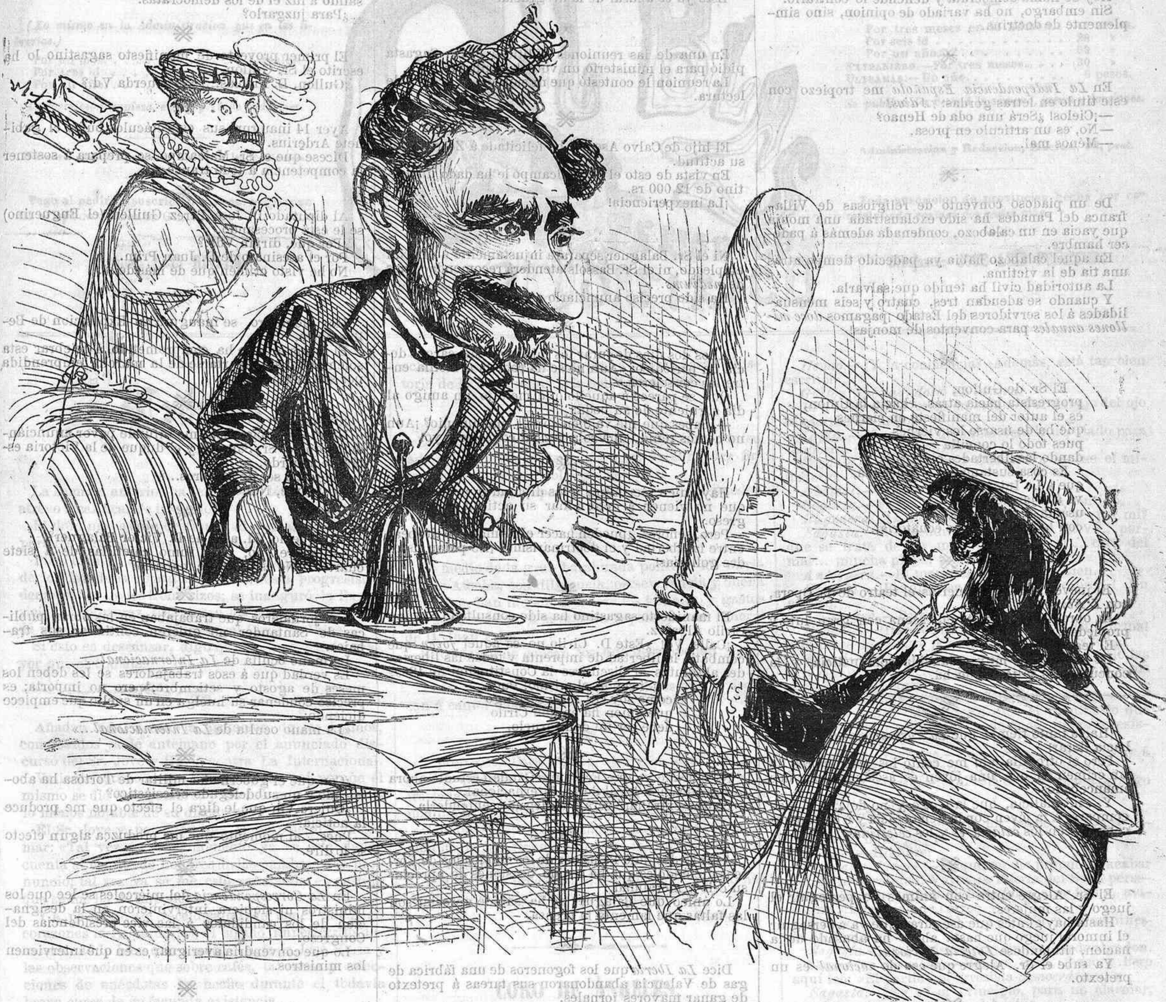
GIL BLAS, para expresar sus simpatías al nuevo presidente del Congreso, le ofrece una campanilla propia de su carácter.

Si lo más corto fuera lo mejor, no tendría yo más que decir; pero como ni esto es exacto, ni lo es tampoco que lo mejor sea posible siempre, sacó en consecuencia que el consejo de irse siempre—como si dijéramos— derechos al bullo , puede ofrecer sus inconvenientes.