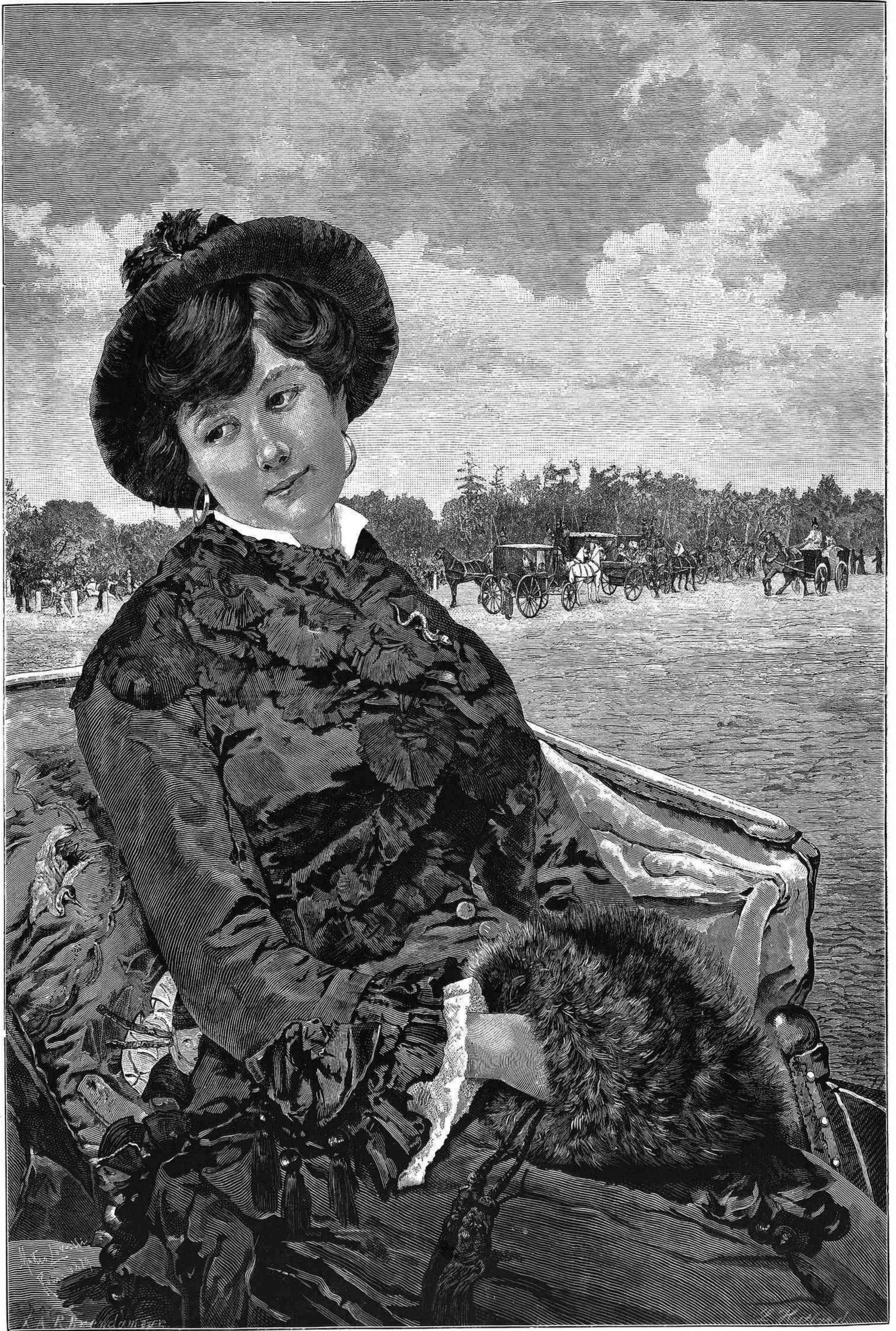
EN EL CORSO, cuadro por M. Lovatti