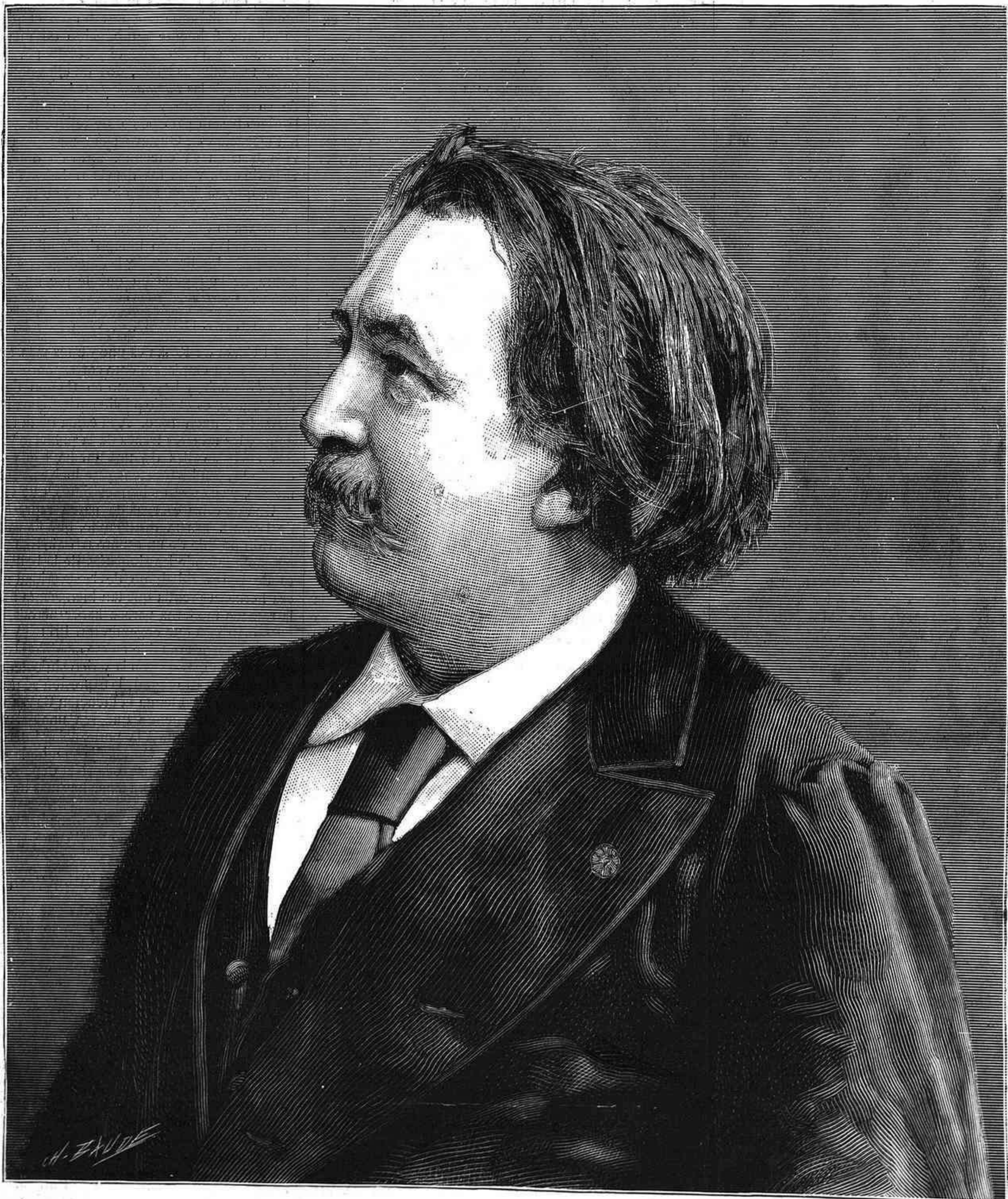
GUSTAVO DORE, fallecido en Paris el 23 de Enero

Las jóvenes sensibles y nerviosas, las que creen en el romanticismo del amor, las que fabrican castillos en el aire,