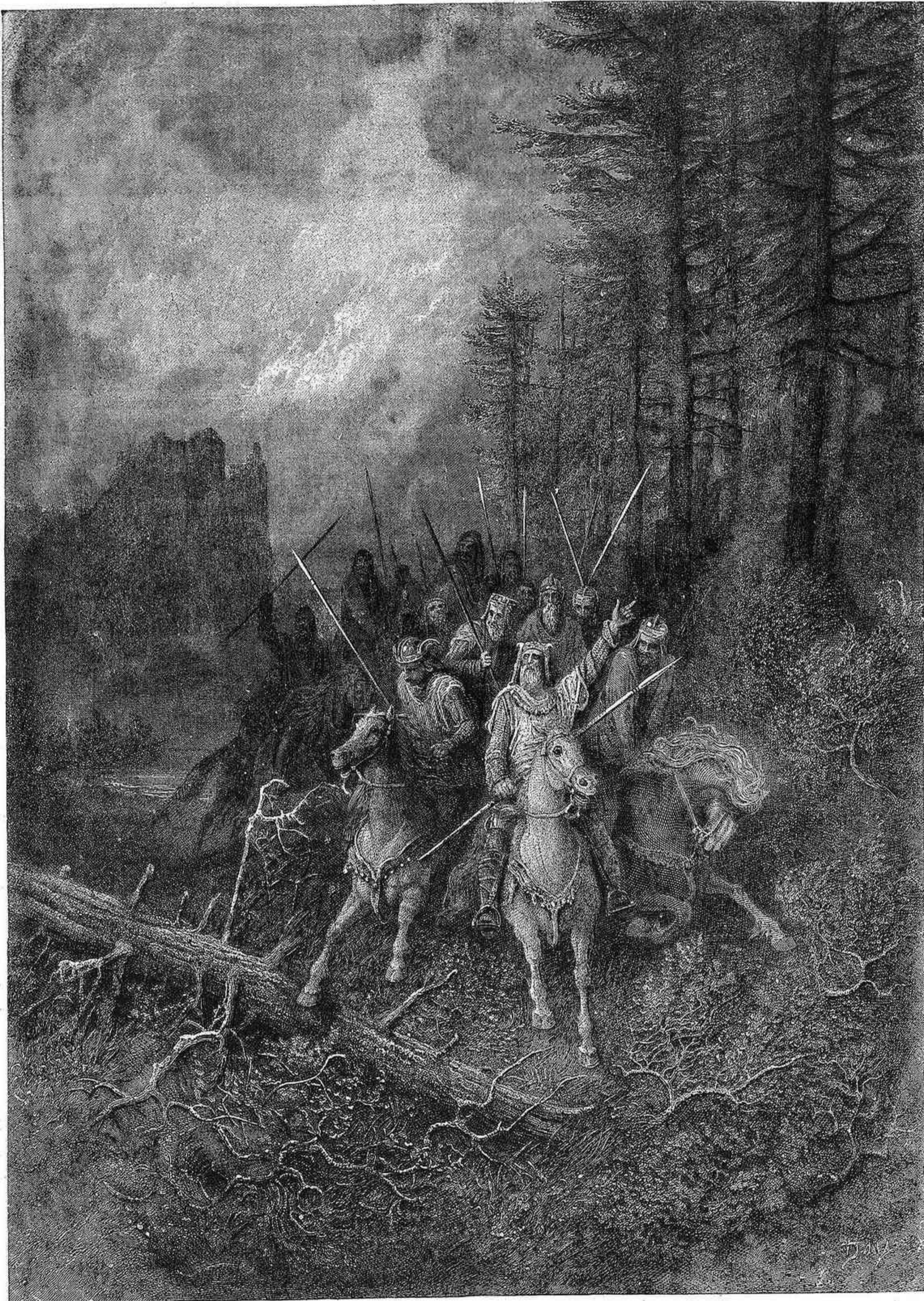
Reproduccion de un grabado sobre acero, dibujo de Gustavo Doré

LAS ISLAS INGLESAS DE SANTA ELENA Y DE LA ASCENSION. —La isla de Santa Elena está situada en el Océano Atlántico entre los 15° 54' y 16° 1' de latitud