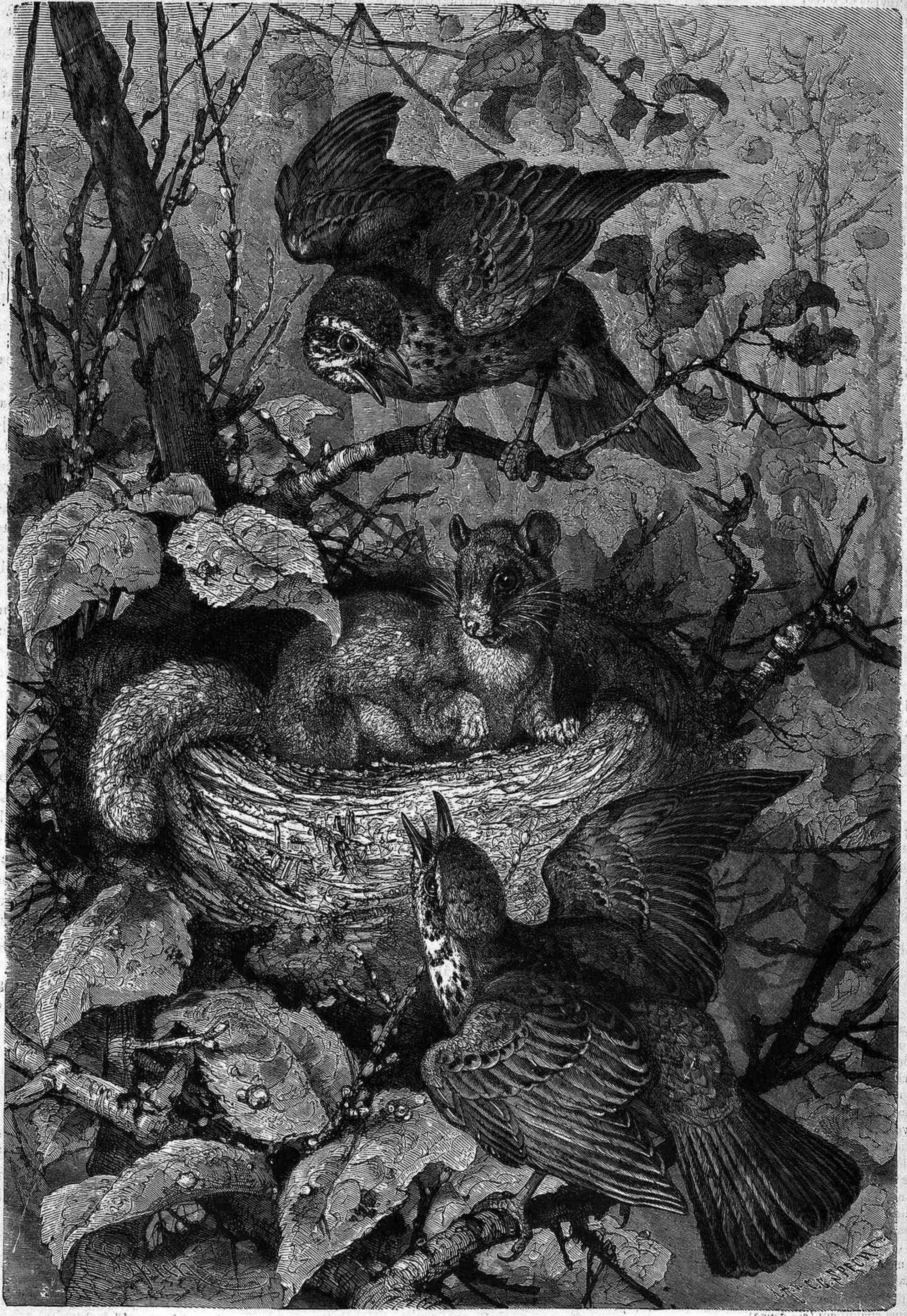
Violación de domicilio.