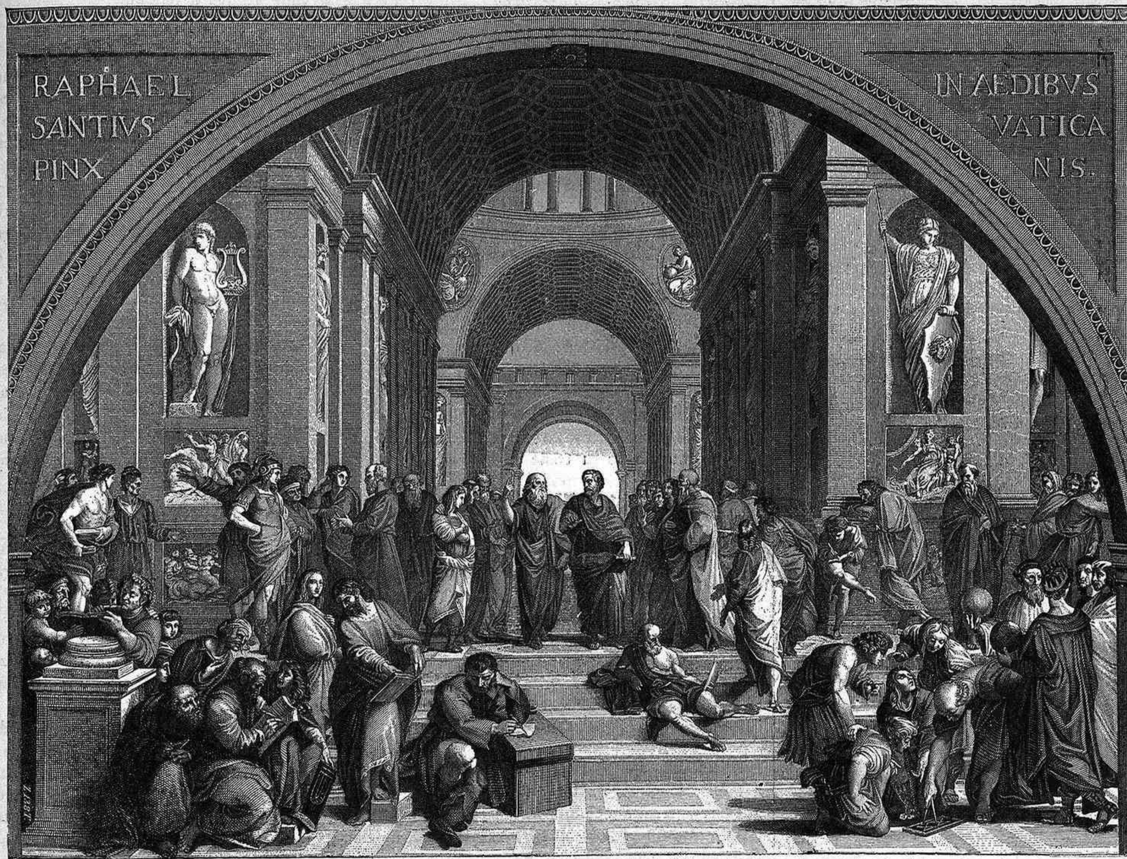
ROMA.—Las Estancias de Rafael en el Vaticano.

Y hay sin embargo que convenir en que el origen de este instrumento, si no es español, le falta muy poco. Mellado dice ex cathedra , en su dic-