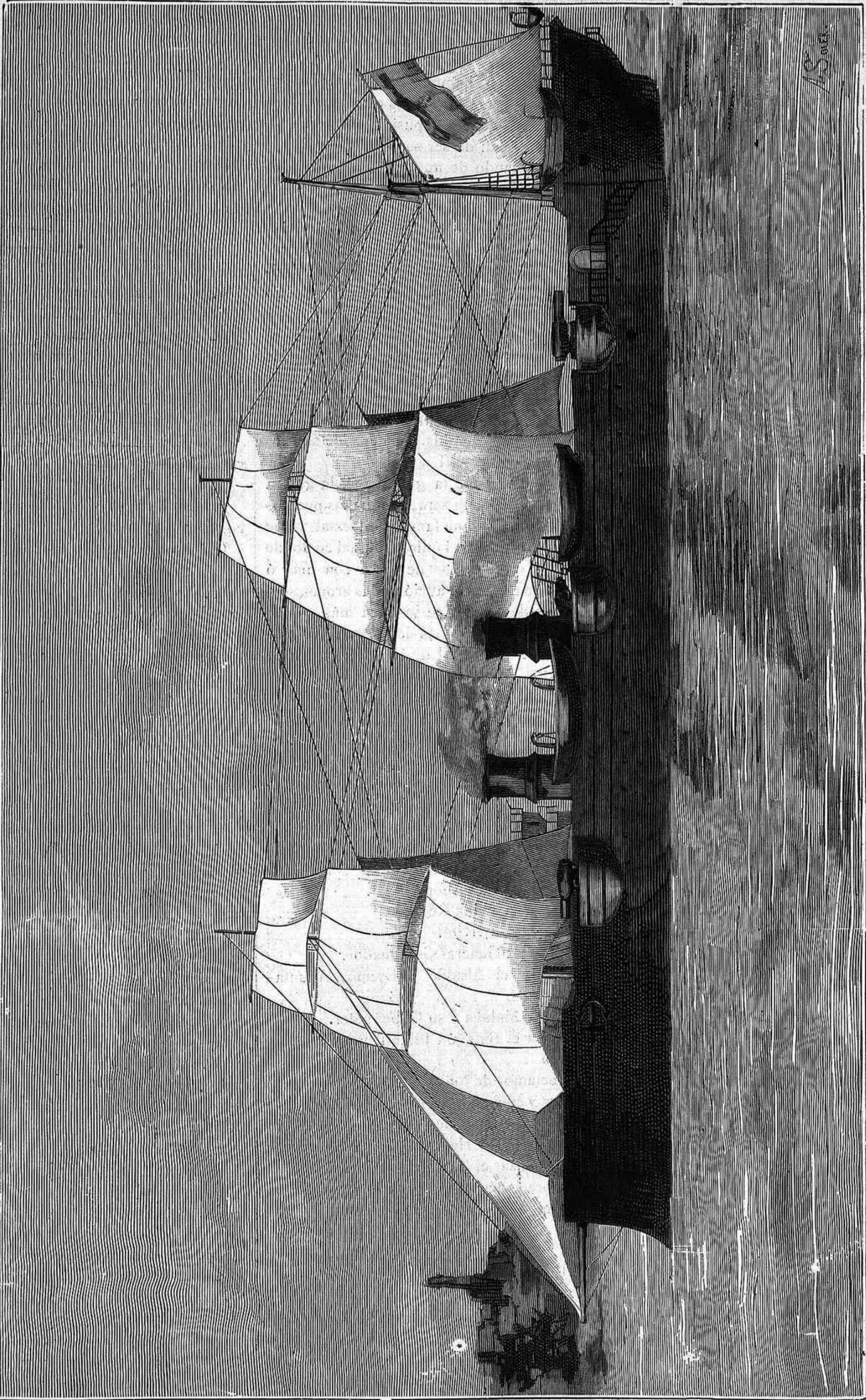
MARINA DE GUERRA.—El crucero «Reina Cristina.»