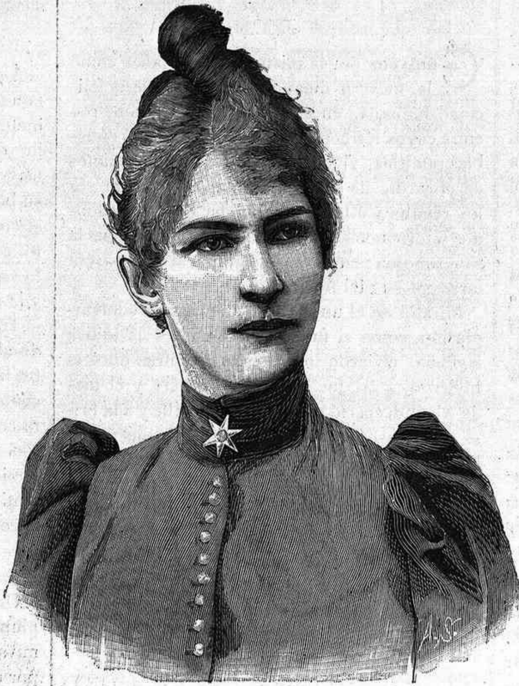
La Baronesa de Rahden.

Lo que decía el alcalde de una villa aragonesa, respondiendo á las quejas de un cómico ambulante, desairado para las funciones de feria, por complacer á otro cómico también de los de á vuela lengua: