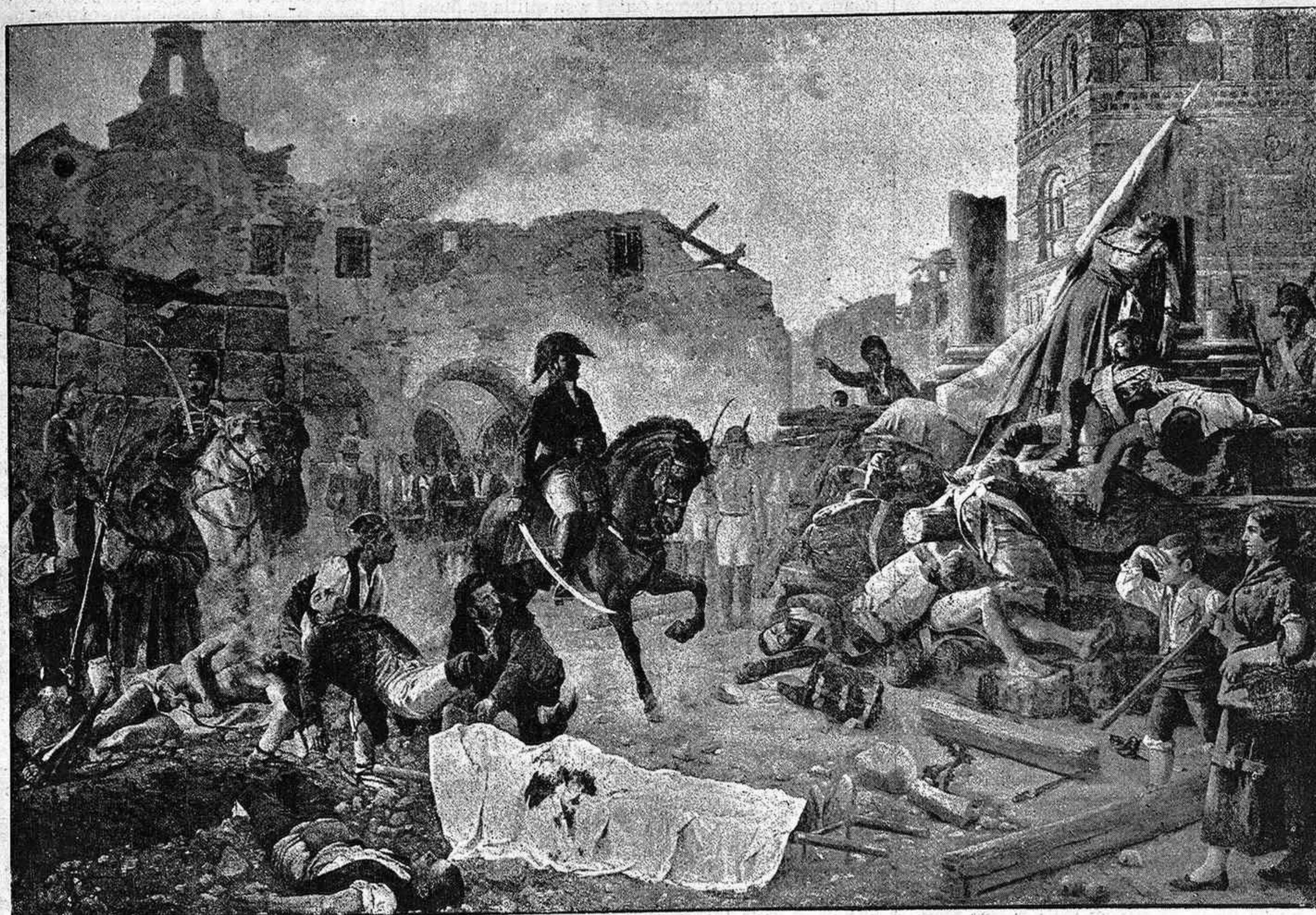
ZARAGOZA.—Después del combate.

De estas cuatro Estancias, es la más admirable, sin duda, por su valor artístico, la que se llama de la escuela de Atenas ó «de la Firma»,