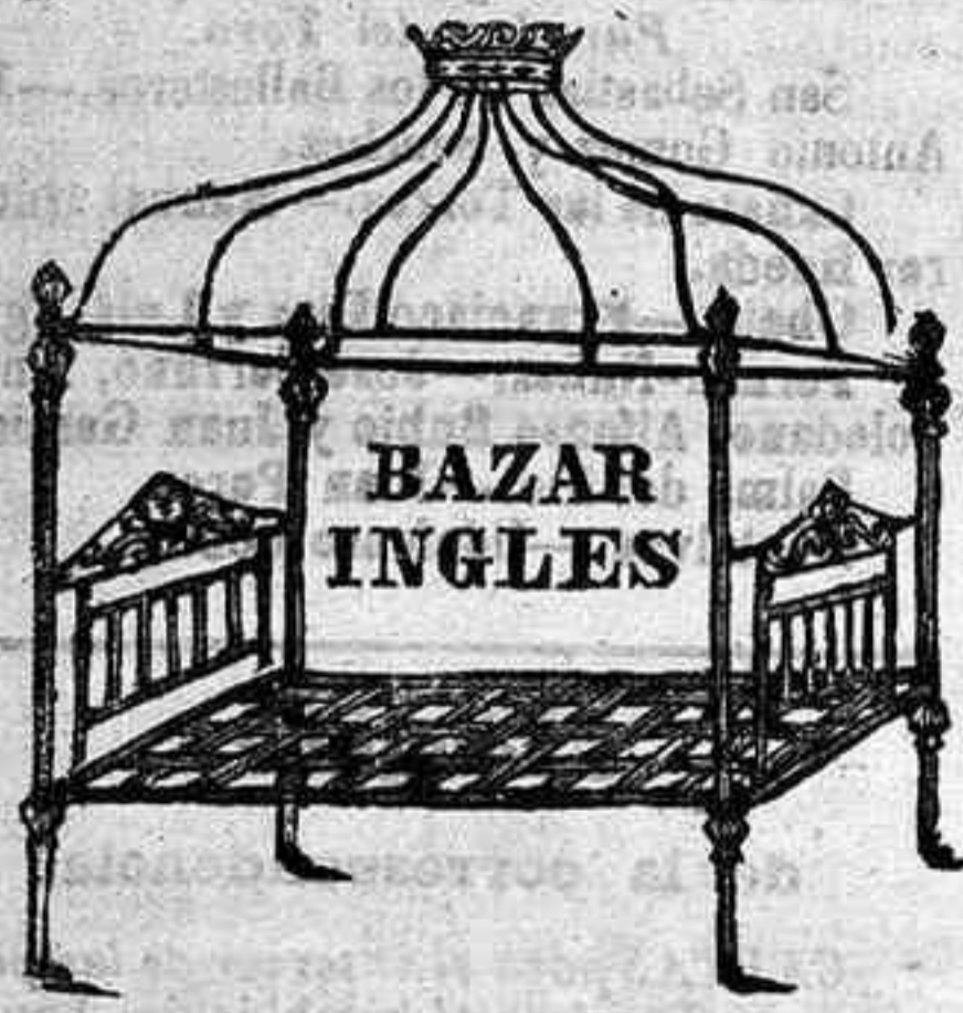
Ambrosio de Morales, frente á la cuesta de Lujan.

Piano. Se vende uno de mesa, en buen estado, propio para un principiante. Su precio muy arreglado.