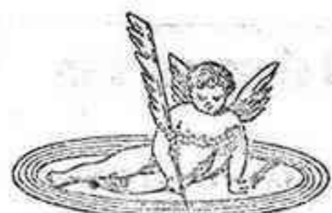
Marcas de fábrica depositada

está depositada con arreglo á lo que marca la ley y pertenece solamente á nuestra casa: no es, pues, la denominación de las máquinas parlantes ó fonógrafos, sino que se aplica especialmente á nuestro aparato, diferente de los otros en su estructura é invención.