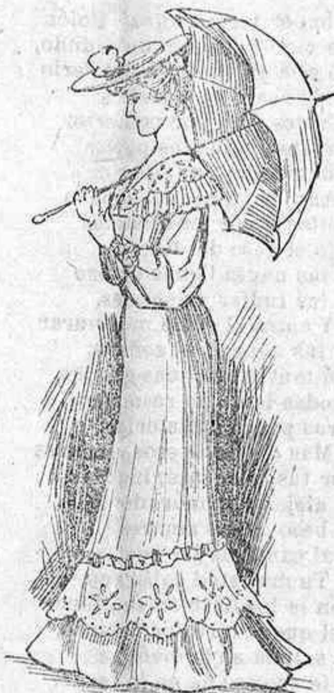
Vistoso traje para paseo, playa y espectáculos al aire libre.

Chaqueta llamada «glacé», de seda, color claro, escotada, con dos órdenes distintos de blondas en el cuello; manga sujeta á la muñeca por blondas también. Falda adornada con otra tira de blondas y otras más anchas después que hagan «pendant» con las del escote.