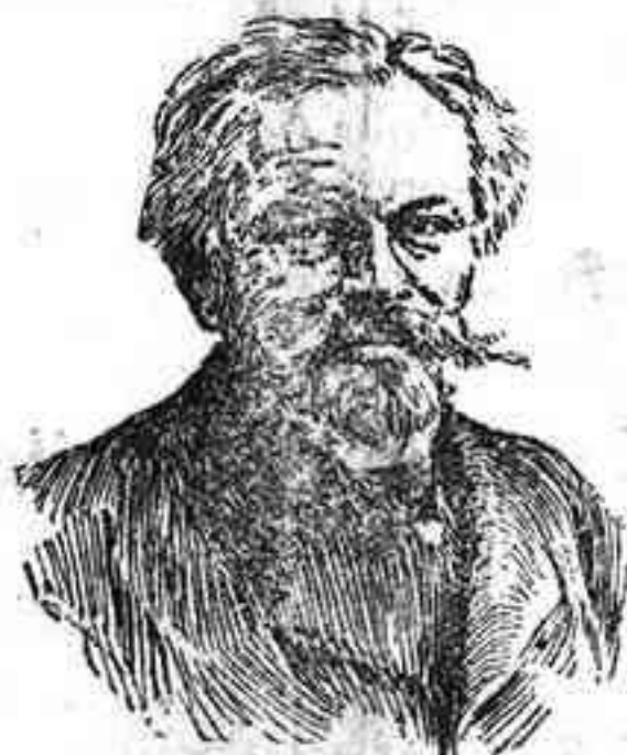
Muerto ilustre.—El insigne literato francés Julio Lemaitre, fallecido en París el viernes último.