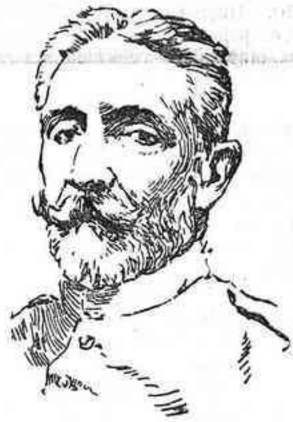
El nuevo Comandante general de Ceuta, señor Alfau

El Ministro de la Gobernación, FERNANDO MERINO.