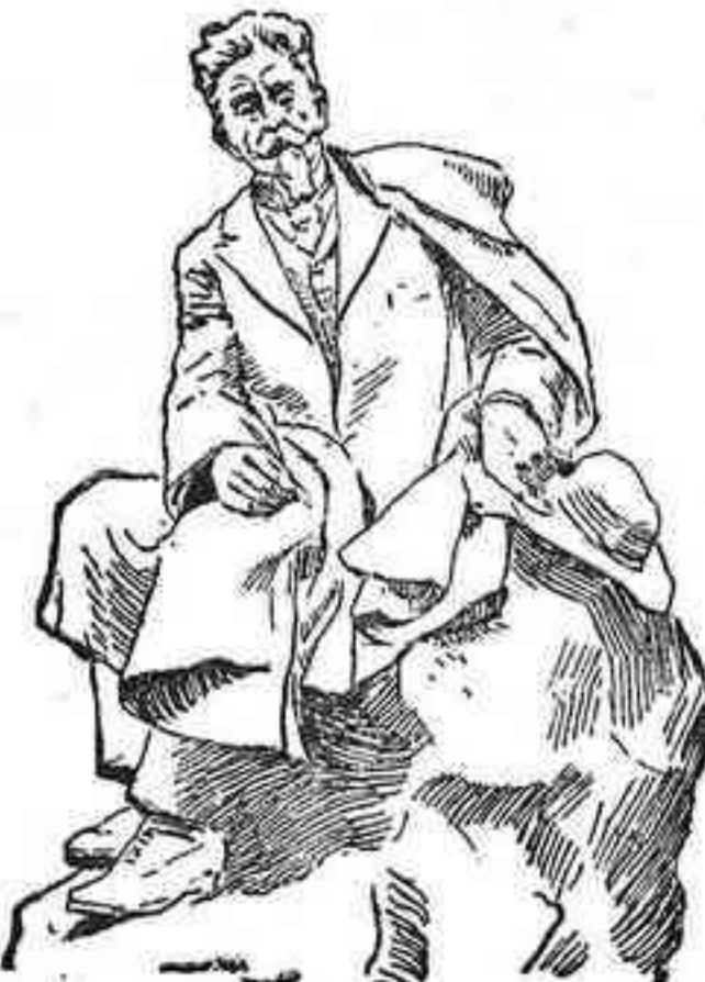
La estatua de Pereda, que corona el monumento

En breve Santander verá elevarse en uno de sus lugares más bellos y pintorescos, el monumento que la Montaña erige á su hijo el ilustre novelista don José de Pereda, el que, como nadie, llevó al libro sus costumbres, sus paisajes, su ambiente y sus tipos más clásicos.