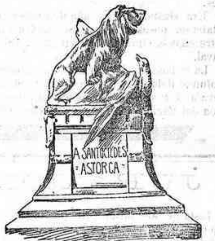
Monumento á los Sitios de Astorga

En el programa de la conmemoración figuraba, como era natural, un señalado homenaje al heroico general que fué alma de la esforzada defensa, al que sin más elementos que una corta guarnición y el auxilio prestado por el paisanaje, parapetados tras de débiles murallas, defendió la ciudad durante veinticuatro días, causando más de ochocientas bajas al ejército del general Junot.