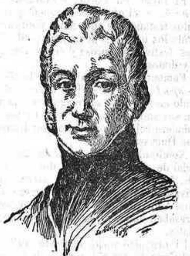
El general Santocildes

Astorga acaba de celebrar el primer centenario de los Sitios por las huestes napoleónicas.