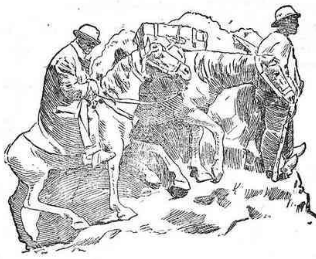
Uno de los grupos del monumento

El escultor Coullaut Valera, de quien es el monumento, puede mostrarse orgulloso de su inspiración y de su potencia artística.