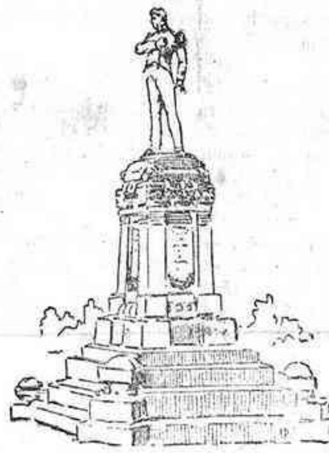
Monumento que Antequera erige á su inmortal hijo el capitán Moreno.