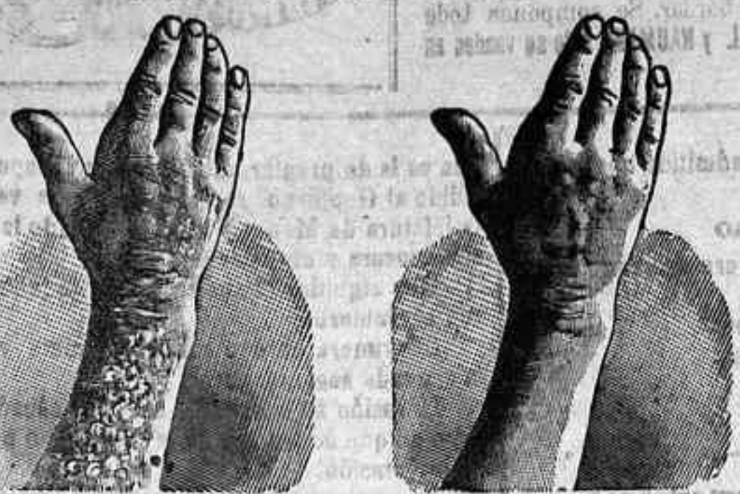
Antes de la curación. Después de 15 días de tratamiento

Curación de las enfermedades de la piel y también de llagas de las piernas LA SANGRE