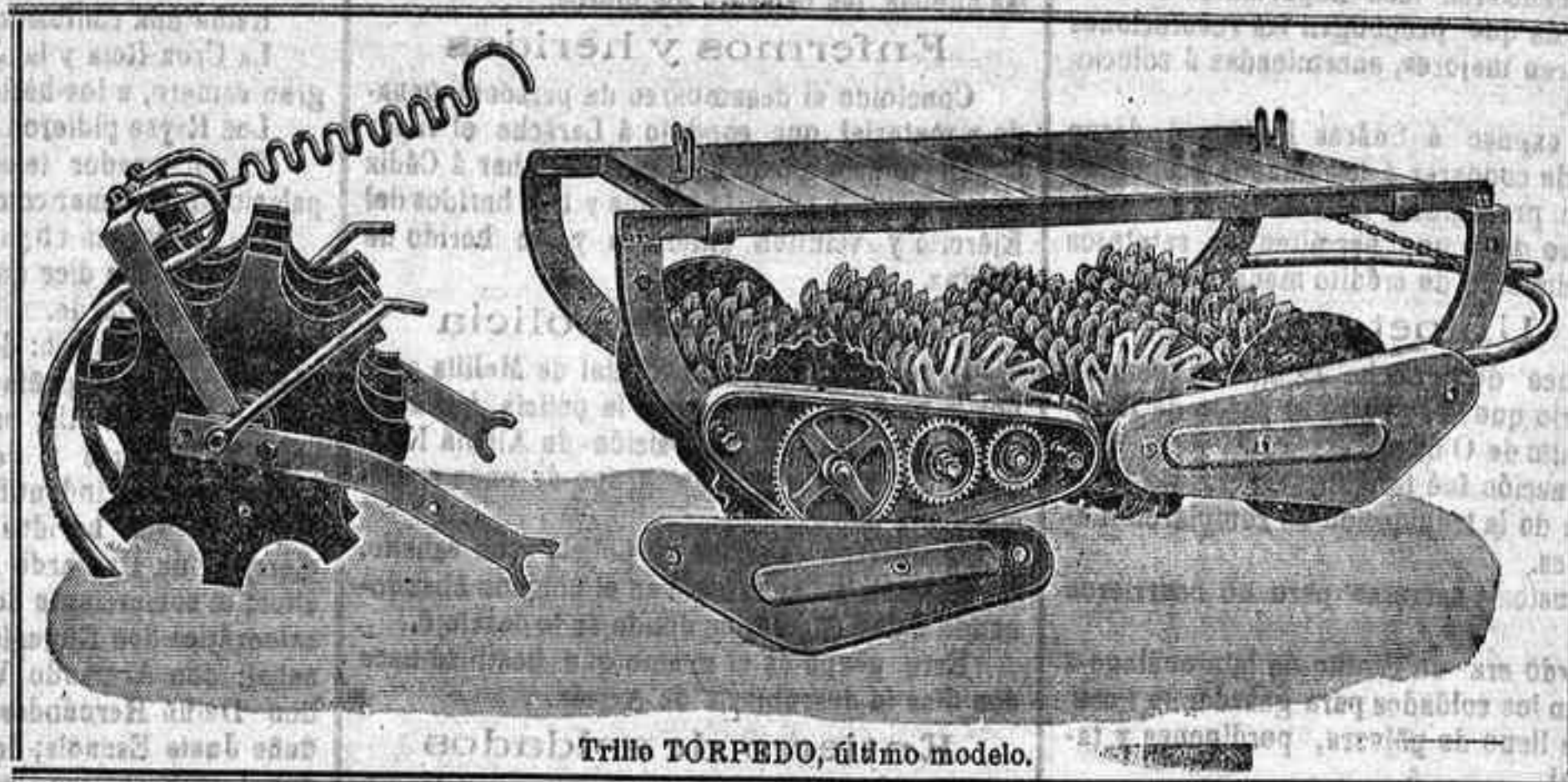
Trillo TORPEDO, último modelo.

Arados y Sembradoras Bud-Sack .—Distribuidoras de abonos Westfalia .—Segadoras y guadañadoras Deering Ideal .—Trillos rotativos reformados Torpedo .—Arados Melotte y Plutón .—Cultivadores Planet .—Gradas de flejes Hércules .