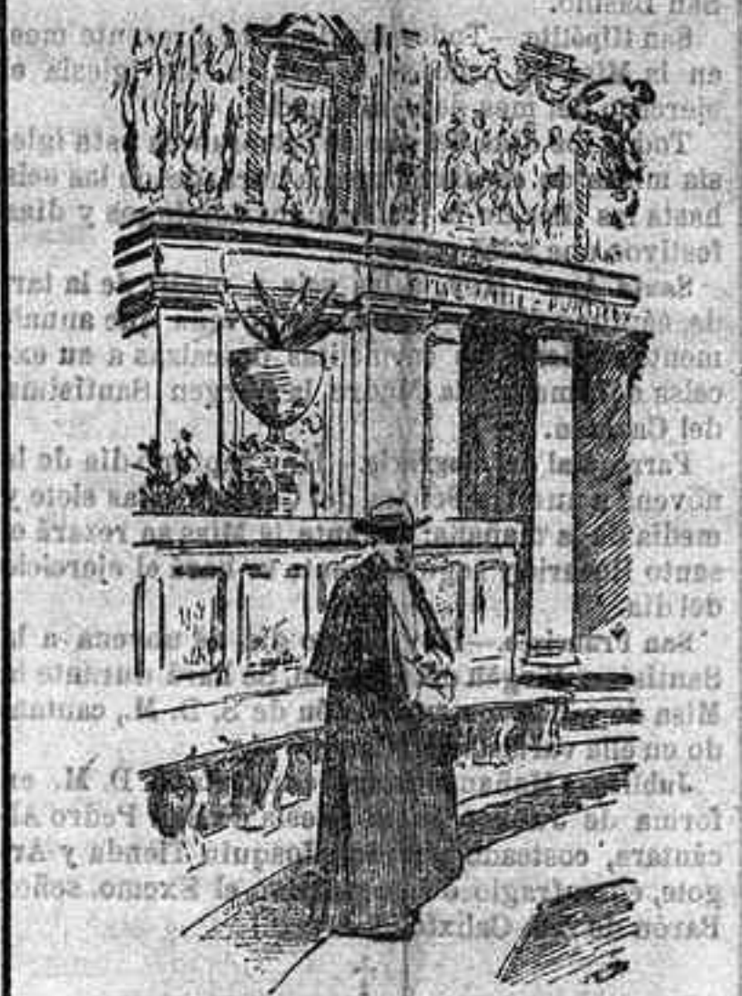
Su Santidad en el lugar llamado el Casino, de los jardines del Vaticano.

Ya ha bajado Su Santidad el Papa a los jardines del Palacio del Vaticano; ya se le puede considerar, por tanto, fuera de la convalecencia de su última y gravísima enfermedad.